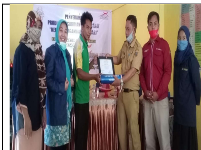
Penyerahan Media Kembang dari Kepala Desa Kepada Guru SD

Kata kunci : Inovasi, Media belajar, Kertas Bergambar