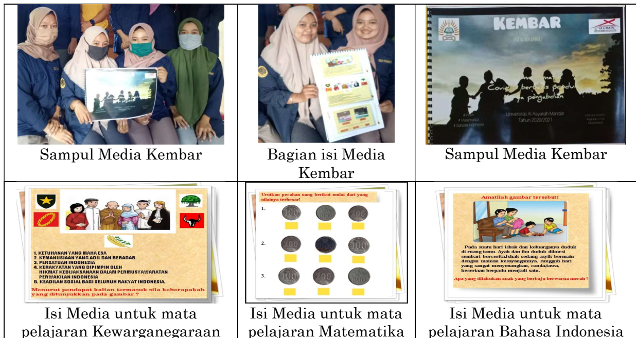
Gambar 2. Produk Media KEMBAR dan Pendampingan Implementasi Media dalam Pembelajaran

Cara penggunaan media ini adalah dengan memperlihatkan gambar kepada siswa, selanjutnya siswa diminta untuk mendeskripsikan apa maksud dari gambar tersebut, tetapi sebelumnya kertas bergambar ini telah dilengkapi penjelasan terinci dibelakang gambar sehingga memudahkan guru mencocokkan jawaban siswa dengan jawaban/ ilustrasi gambar sebenarnya. Setelah siswa memberi pendapatnya secara bergiliran tentang gambar yang telah dilihat, guru pun memberi pujian terhadap setiap pendapat siswa. Guru selanjutnya memberi penegasan terhadap jawaban siswa, sehingga siswa dapat memahami dengan baik materi yang disampaikan melalui Media Kembar tersebut.