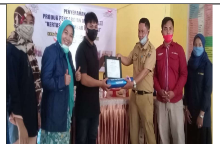
Penyerahan Media Kembang dari Kepala Desa Kepada Guru SD