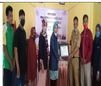
Penyerahan Media Kembang dari Rektor kepada Kepala Desa