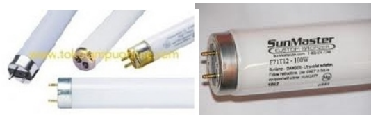
Gambar 2. Jenis Lampu Fluorecent