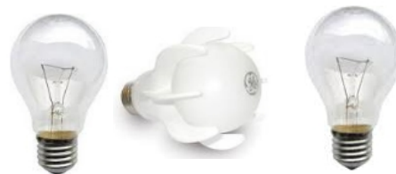
Gambar 1. Jenis lampu incandescent