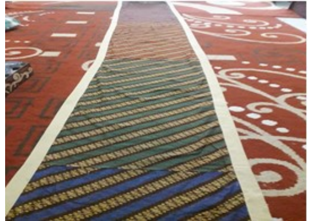
Gambar 10. Kain sinjang yang sudah dijahit. (Foto: Dok. M. Irfan, 12 Maret 2020)

berjalan mengikuti hamparan kain sinjang yang sudah digelar. Kain sinjang terdiri atas warna berbeda dan sudah dijahit, hal ini dimaksudkan untuk mempermudah pemakaiannya tanpa harus menyusunnya satu persatu. Adapun faktor lain, dikarenakan jarak antara kamar dan tempat ngibakan yang biasanya jauh sehingga tidak akan sampai jika hanya menggunakan tujuh kain sinjang saja.