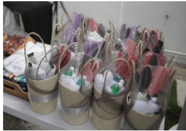
Gambar 16. Souvenir untuk yang memandikan.

Prosesi ngibakan ini memiliki kesamaan dengan bentuk lama namun sebelum mendatangi orang tua dan calon pengantin gentong akan diisi terlebih dahulu oleh air hangat agar nantinya calon pengantin tidak merasa kedinginan. Namun setelah proses penyiraman oleh para sesepuh atau orang yang dituakan ini akan memperoleh bingkisan yang berupa peralatan bersih-bersih diri yang terdiri atas cermin, sabun, sampo, sisir, serta handuk yang biasanya dipesan kepada MSID sebagai tanda terima kasih dari orang tua pihak calon pengantin kepada keluarga yang telah ikut menyiram dan mendoakan calon pengantin.