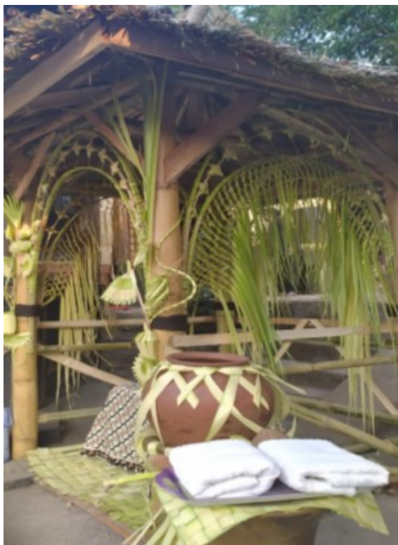
Gambar 12. Bale tempat pelaksanaan upacara Ngibakan .

Pelaksanaan Ngibakan bentuk lama diawali dengan orang tua menuju ke sebuah bale ( saung ) yang berada di halaman luar yang akan dijadikan tempat dilaksanakannya upacara ngibakan . Bale ini dibuat secara gotong royong oleh keluarga dari calon pengantin termasuk dalam pembuatan janur yang digunakan sebagai dekorasinya, di tempat tersebut sudah disediakan peralatan berupa gentong tanah liat, siwur batok atau gayung dari batok kelapa, tujuh kendi yang berisi air dari tujuh sumur atau tujuh mata air, ulekan tanah liat, gunting, parawanten , dan kain putih.