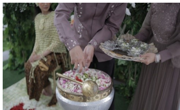
Gambar 14. Prosesi pencampuran air tujuh sumber.

Pada perkembangannya, prosesi sama dengan bentuk lama yaitu dengan mencampur air namun dari wadah kristal kemudian air dari tujuh sumber ke dalam gentong kuningan yang berisi bunga setaman, melati, dan beberapa bunga mawar utuh oleh kedua orang tua untuk diaduk-aduk.