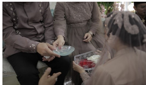
Gambar 7. Prosesi menaburkan bunga kedalam air ngaras.

Pada perkembangannya kemudian, peralatan yang digunakan untuk mengucurkan air terbuat dari bahan kaca yang dikucurkan ke dalam sebuah bejana yang terbuat dari kristal yang berisi melati. Proses ini dilanjutkan oleh ibu yang akan menaburkan bunga mawar berwarna putih sebagai lambang kesucian dan ayah akan menaburkan bunga mawar berwarna merah sebagai lambang jajaten atau keberanian ke dalam air tersebut.