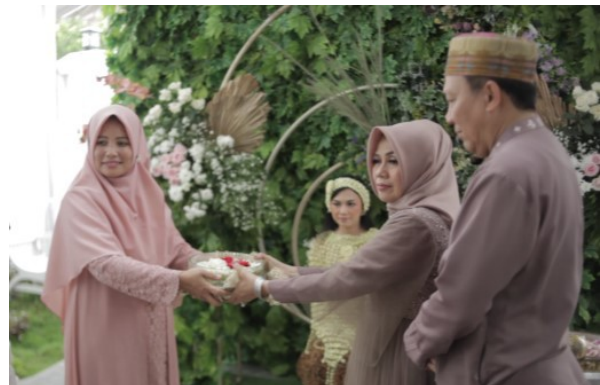
Gambar 11. Penyerahan air doa dari pimpinan pengajian.

Setelah ngaras dilaksanakan selanjutnya merupakan penyerahan air yang terdapat pada dua wadah besar yang akan dipakai prosesi ngibakan dari pimpinan tausiah kepada orang tua, selanjutnya penyerahan salah satu wadah dari orang tua kepada perwakilan keluarga pria yang kemudian didokumentasikan. Prosesi ini juga merupakan bentuk baru yang sebelumnya tidak ada.