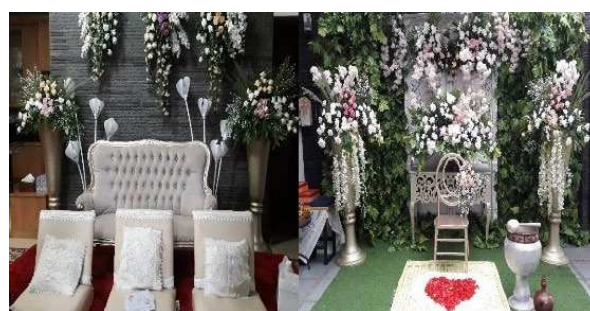
Gambar 23. Salah satu model Dekorasi Ngaras dan Ngibakan MSID.

Bapak Ende mengatakan bahwa dekorasi ini bukan hanya terdapat pada upacara ngaras saja namun dekorasi terdapat pada tempat upacara ngibakan sehingga terdapat dua spot dekorasi yang berbeda yang memberikan kesan indah serta mewah bagi penggunaannya. Harga dekorasi untuk upacara ngaras dan ngibakan ini berkisar pada harga Rp.4.000.000,- hingga yang paling mewah Rp. 10.000.000,- sesuai permintaan dari pemangku hajat 2 .