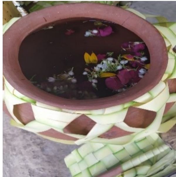
Gambar 13. Gentong tanah liat berisi air untuk Ngibakan .

Prosesi diawali dengan mencampurkan air tujuh sumur dari kendi ke dalam gentong yang berisi bunga setaman oleh kedua orang tua yang kemudian mengaduk-aduknya.