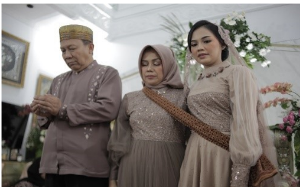
Gambar 3. Prosesi ngecagkeun aisan . (Foto:Dok. M. Irfan, 12 Maret 2020)

Perbedaan pada perkembangannya lilin yang digunakan menggunakan lilin bulat yang di simpan pada tempat kristal serta prosesi ini berjalan melewati hamparan kain sinjang yang telah disediakan.