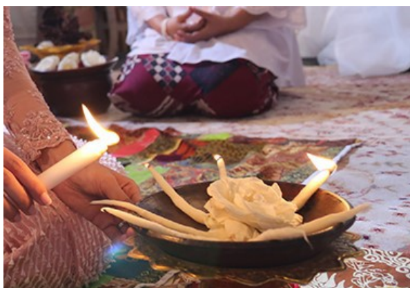
Gambar 4. Menyalakan Sumbu di atas Coet . (Foto: Dok. The Bride , 12 Mei 2013)

Setelah menguraikan arti yang terkandung di dalam aneka dedaunan, dilanjutkan pada prosesi berikutnya di mana calon pengantin dipersilakan untuk menyalakan pelita, yang terdiri atas lima sumbu pelita yang disusun di dalam coet tanah liat (cobek) hal ini dimaksudkan agar pada saatnya nanti berumah tangga, sang mempelai harus tetap mampu menyalakan lima unsur dalam rumah tangga yaitu Islam, iman, shiddiqiyah (kejujuran), sa'adah (kebahagiaan), dan muraqabah (mawas diri). Adapun pelita tersebut ditempatkan di dalam coet tanah liat, sebagai pengingat bahwa semua manusia terbuat dari tanah dan akan kembali ke tanah.