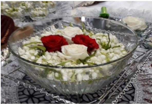
Gambar 2. Bokor tempat air Doa. (Foto: Dok. M. Irfan, 10 Januari 2020)

kah untuk dicampurkan ke dalam gentong dalam prosesi ngibakan