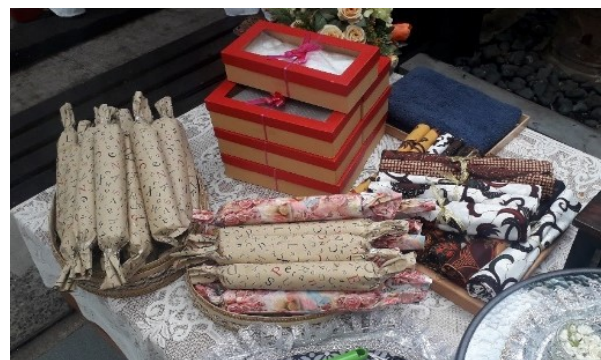
Gambar 20. Kain sinjang dan hadiah yang akan dijadikan sawer

Sebagai pengganti dari rebutan parawanten yang terdiri aneka macam maka ditambahkan prosesi sawer kain sinjang yang akan disawerkan atau dilempar oleh keluarga di mana para tamu nantinya akan saling berebut untuk mendapatkannya. Selain sawer sinjang terkadang keluarga juga akan melemparkan beberapa hadiah lain seperti mukena, sajadah, uang, serta permen yang dimaknai agar calon pengantin mendapat kelancaran rezeki dengan berbagi. Selain itu, para tamu juga diperbolehkan untuk mengambil air siraman yang dipercaya dapat menjadi doa agar lancar jodoh.