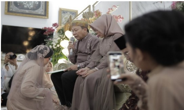
Gambar 5. Prosesi sungkem dan Izin kepada Orang tua.

dan nenek serta saudara kandung pada saat ini biasanya pemangku hajat meminta untuk dibuatkan isi kata-katanya oleh MSID.