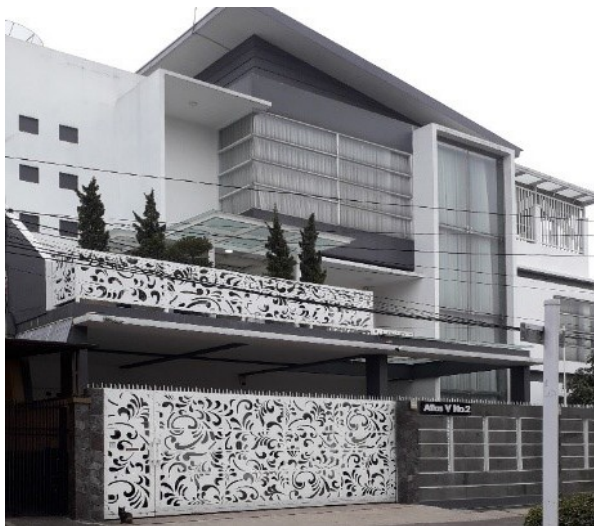
Gambar 24. Hunian Salah satu pemangku Hajat.

Selain pekerjaan hunian para pemangku hajat ini juga dapat diklasifikasikan ke dalam masyarakat kelas menengah ke atas yang bertempat tinggal di beberapa kompleks elit di Kota Bandung.