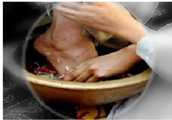
Gambar 6. Mencuci kaki orang Tua di dalam paso .

Prosesi ini dilambangkan sebagai kasih sayang yang dicurahkan oleh kedua orang tua kepada anaknya. Setelah air dari dalam kendi itu habis, maka air yang sudah berada di dalam paso selanjutnya dipergunakan untuk membasuh kaki kedua orang tua dengan air kembang dari paso dengan penuh hormat oleh sang calon mempelai. Sambil membasuh kaki, sang calon mempelai dihantar oleh pemandu adat untuk membacakan doa keselamatan bagi kedua orang tua. Jika kaki kedua orang tua telah selesai dibasuh, maka sang calon mempelai selanjutnya melapnya dengan sapu tangan hingga kering. Setelah itu disemprot wewangian dari parfum. Terakhir, sambil bersimpuh di kaki kedua orang tuanya serta mencium kedua kaki orang tuanya seraya membacakan doa.