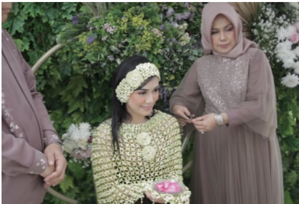
Gambar 18. Prosesi Memotong Rambut.

memasangkan handuk kimono oleh ayah dan kemudian berganti baju.