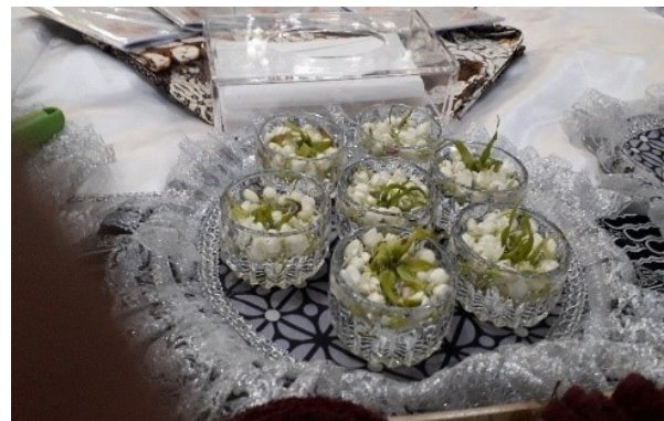
Gambar 1. Air tujuh Sumber didalam gelas kristal.

Ketujuh air ini masing-masing dimasukkan ke dalam mangkuk kristal kecil dan diberi taburan bunga melati kuncup dan bunga kenanga.