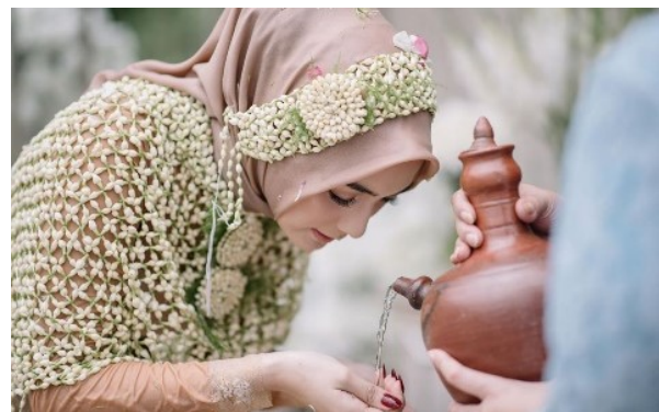
Gambar 17. Prosesi berwudhu.

Pada pengembangan terdapat prosesi berwudhu bagi yang beragama islam setelah prosesi ngibakan , agar lebih sempurna air wudu bersumber dari kendi yang dikucurkan oleh kedua orang tua.