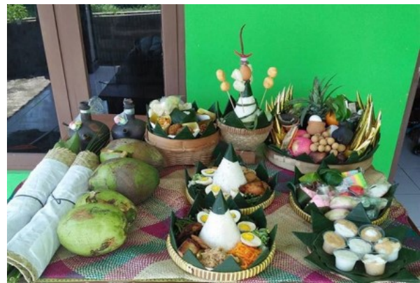
Gambar 19. Parawanten. (Foto: Dok. Guntur, 7 Februari 2019)

nyiru (satu buah tampah besar), boboko (bakul), cukil (sendok nasi), hihid (kipas dari bambu), coet (cobek tanah liat), mutu , aseupan (kukusan berbentuk kerucut), kacip (alat pembelah pinang), beras semangkuk, lemareun atau bahan-bahan untuk menyirih, rujakeun (buah-buahan untuk membuat rujak), hahampangan (kue kering seperti opak, kolontong, borondong dan lain-lain), jajanan pasar seperti kue basah seperti nagasari, bugis, apem dan lain-lain), bubur merah putih, congcot puncak manik (nasi yang diambil dari puncak kukusan), di atasnya disimpan telur rebus dengan kulitnya, pisang emas satu sisir, pisang raja satu sisi, samara badag (bumbu-bumbu seperti lengkuas, salam dan sebagainya), bumbu dapur (garam gandu, gula gandu, kelapa muda satu butir, kelapa tua satu butir, daun pisang satu kompet atau satu ikat, kayu bakar tiga potong, rampe atau bunga sebungkus, rokok dan korek api, benang putih dan hitam, jarum, kemenyan putih, dupa, bedak, sisir, cermin, minyak kenanga, minyak wangi, tujuh macam buah, macam-macam umbi, gula, kopi, semuanya ditutup oleh kain warna putih.