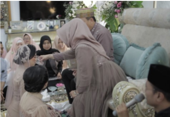
Gambar 9. Meminumkan air zam-zam. (Foto: Dok. M. Irfan, 12 Maret 2020)

Prosesi ini adalah prosesi meminum kan air zamzam yang merupakan kreativitas yang ditambahkan pada MSID, air zam- zam sudah disediakan pada gelas kecil di minumkan oleh orang tua yang diawali oleh ibu kemudian ayah kepada calon pengantin dan sebaliknya dari calon pengantin kepada ibu dan ayah, dilanjutkan dengan orang tua meminum kepada adik atau kakak dari calon mempelai sebagai perlambang keberkahan dan diharapkan sekeluarga dapat pergi ke tanah suci dan meminum air zam-zam secara langsung di sana.