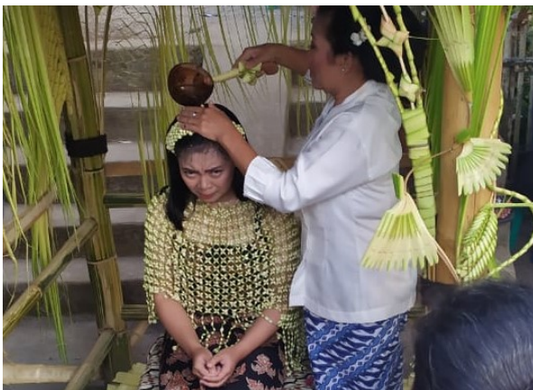
Gambar 15. Proses ngibakan oleh Ibu.

Ngibakan dilanjutkan oleh orang yang dituakan oleh calon pengantin atau disebut sepuh dan pinisepuh seperti kakek, nenek, paman atau uwa dari calon pengantin yang berjumlah ganjil yaitu, tujuh, sembilan, atau paling banyak sebelas orang.