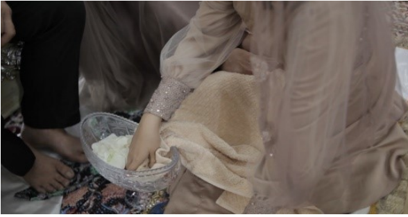
Gambar 8. Prosesi Mencuci Kaki orang tua.