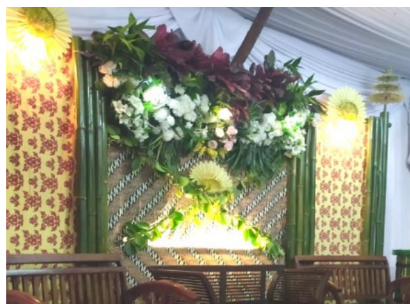
Gambar 22. Dekorasi Lama Upacara Ngaras

Dekorasi upacara ngaras dan ngibakan pada zaman dahulu tidak seperti pada zaman sekarang, terutama pada upacara ngibakan disebabkan upacara ini lebih dulu ada sebelum ngaras dekorasi berupa anyaman janur yang dibuat sedemikian rupa yang merupakan adopsi dari kebudayaan Jawa dan priyayi Sunda, di mana seluruh prosesnya dilakukan oleh keluarga. Sedangkan dalam ngaras ini lebih berkembang namun tetap sederhana.