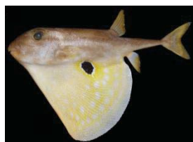
Ikan buntal laut dalam langka Trionax macropterus Lesson (1831)

Jurnal Iktiologi Indonesia (JII) adalah jurnal ilmiah yang diterbitkan oleh Masyarakat Iktiologi Indonesia (MII) tiga kali setahun pada bulan Februari, Juni, dan Oktober. JII menyajikan artikel lengkap hasil penelitian yang berkenaan dengan segala aspek kehidupan ikan (Pisces) di perairan tawar, payau, dan laut. Aspek yang dicakup antara lain biologi, fisiologi, taksonomi dan sistematika, genetika, dan ekologi, serta terapannya dalam bidang penangkapan, akuakultur, pengelolaan perikanan, dan konservasi.