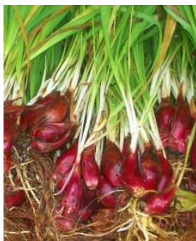
Gambar 1. Eleutherine bulbosa Mill.

Simplisia umbi lapis (bulbus) dari E. bulbosa yang dikeringkan diekstraksi dengan kloroform untuk menarik senyawa metabolit sekunder yang ada di dalamnya. Ekstraksi dilakukan dengan metode maserasi pada suhu kamar diikuti dengan dua kali remaserasi supaya memperoleh rendemen ekstrak yang optimal. Dari hasil maserasi diperoleh ekstrak seberat 23.5 g yang kemudian dipisahkan dengan MPLC menggunakan kombinasi pelarut n-heksana:etil asetat (100:0-0-100). Fraksi 7 (persentase n-heksana: etil asetat=70:30) kemudian dipisahkan dengan kolom kromatografi fase normal menggunakan pelarut n-heksana: etil asetat=5:1 diikuti dengan KLT preparatif (n-heksana: etil asetat=1:1) menghasilkan suatu senyawa isolat (4 mg). Senyawa tersebut selanjutnya dielusidasi strukturnya dengan bantuan analisis LR-EIMS serta 1D dan 2D NMR.