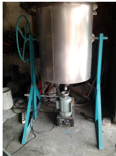
Gambar 1. Alat mesin ekstraktor

Ekstraktor inaktivasi enzimatis dipabrikasi di bengkel Glass Blower Yogyakarta. Mesin ekstraktor gaultherin terdiri dari dua bagian utama, tangki ekstraktor dan unit pengendali. Tangki ekstraktor terdiri dari motor penggerak, pisau penghancur, dan pengaduk. Sedangkan unit pengendali berupa pengatur kecepatan.