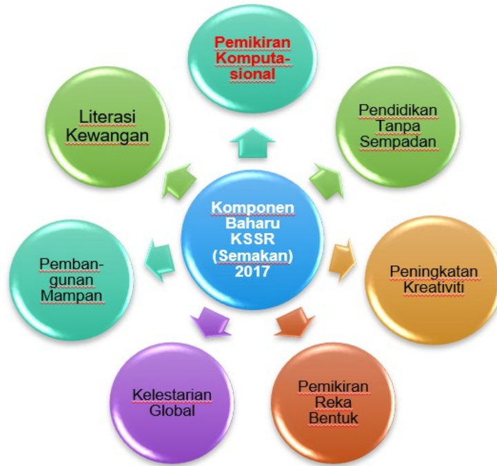
Rajah 1 : Komponen-komponen Baharu Yang Diterapkan ke dalam Kandungan KSSR (Semakan) 2017 (Dipetik daripada Bahagian Pembangunan Kurikulum, Kementerian Pendidikan Malaysia, 2016)

Antara komponen-komponen tersebut, komponen Pemikiran Komputasional telah mendapat perhatian yang tinggi oleh orang ramai, terutamanya golongan pendidik. Justeru, Kementerian Pendidikan Malaysia (KPM) bersama dengan Malaysia Digital Economy Corporation (MDeC), Computing at School dan British Computing Society (BCS) telah menganjurkan kursus kemahiran Pemikiran Komputasional untuk melatih Jurulatih Utama Kebangsaan (JUK) di seluruh negara. Seterusnya, kursus pendedahan asas mengenai konsep dan kemahiran Pemikiran Komputasional selama seminggu telah diberikan kepada segelintir guru dalam perkhidmatan di sekolah-sekolah rendah oleh JUK-JUK tersebut.