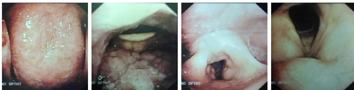
Gambar 4. Hasil laringoskopi fleksibel

Riwayat penyakit dahulu, pasien tidak pernah menderita penyakit serupa sebelumnya, riwayat hipertensi ada, DM tidak ada dan penyakit kronis lain disangkal. Riwayat pengobatan, sebelumnya pasien berobat ke dokter saraf dan penyakit dalam untuk keluhan ini. Pemeriksaan USG abdomen didapatkan fatty liver , pasien mendapat terapi UDCA 2 tablet per 12 jam peroral, omeprazole dari bagian interna. Pasien dikonsulkan ke bagian neurologi dan dilakukan pemeriksaan CT scan kepala. Pasien didiagnosis stroke