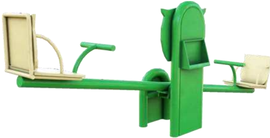
Gambar 4. Final desain