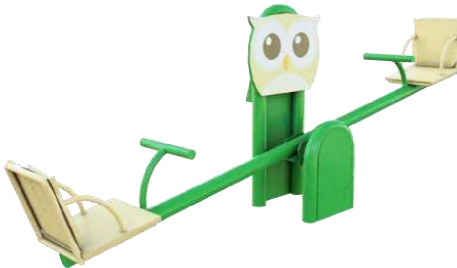
Gambar 3. Final desain

Pengembangan desain awal dalam gambar 2 ini berbentuk burung hantu. Burung hantu dikenal dan banyak digunakan sebagai simbol pengetahuan dan kebijaksanaan karena sifatnya yang jarang berkicau dan banyak diam atau mendengar. Kelebihannya, anak-anak dapat belajar mengenai burung hantu karena burung ini sangat jarang ditemui, dan juga belajar dari sifat burung hantu untuk menjadi diri yang bijaksana. Burung hantu dipasang di bagian tiang agar saat dimainkan tidak mengganggu. Sandarannya berbentuk siluet dari burung hantu sehingga desainnya cocok dengan tema. Kemudian di belakang sandarannya diberi besi rangka agar sandaran lebih kuat dan tidak mudah terlepas.