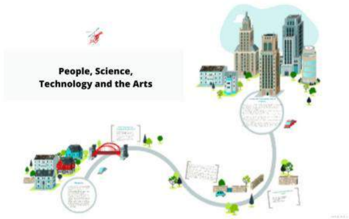
Gambar 2. Ilmu Pengetahuan Manusia

Selama proses sejarah ini, para pencari ilmu juga diberi berbagai nama dalam tradisi tertentu: ilmuwan dan cendekiawan. Dalam Islam, mereka disebut akīm , ārif , ālim , dll, bergantung pada orientasi orangnya[15]. Biasanya, pada satu titik dari proses ini dalam sejarah, baik seorang sarjana atau beberapa sarjana memperhatikan bahwa beberapa mata pelajaran secara inheren berbeda dari yang lain; mereka umumnya dapat menyanai mereka sebagai makhluk tetapi mereka memperhatikan bahwa setiap makhluk tidak dapat diselidiki dengan cara yang setara[16]. Akibatnya, mereka memisahkan beberapa mata pelajaran dari yang lain dan, dengan demikian, untuk mempersatukan bidang studi yang baru didirikan, mereka memberinya reputasi[17]. Selama ini, bidang investigasi yang muncul dibentuk menjadi disiplin dengan konsep yang dipilih karena nama disiplin itu. Fenomena-fenomena yang berciri epistemologis yang terungkap dalam sejarah inilah yang bahkan saya namakan fenomena ilmiah, dan dengan demikian proses-proses yang terjadi dalam sejarah dengan demikian dapat disebut proses ilmiah karena berakhir pada munculnya suatu ilmu tertentu[18].