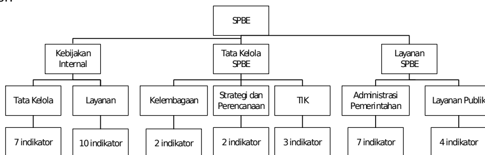
Gambar 2. Struktur Penilaian SPBE

Struktur penilaian SPBE dibagi menjadi tiga bagian yaitu, domain, aspek dan indikator. Domain merupakan area pelaksanaan SPBE yang dinilai, aspek merupakan area spesifik pelaksanaan SPBE yang dinilai, indikator merupakan informasi spesifik dari aspek pelaksanaan SPBE yang dinilai. Struktur penilaian SPBE terdiri dari tiga (3) domain, tujuh (7) aspek, dan 35 indikator.