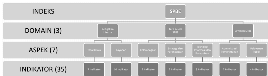
Gambar 2 Struktur Penilaian SPBE

Struktur penilaian pada pelaksanaan SPBE terdiri dari domain, aspek, serta indikator. Berdasarkan PermenPANRB No. 5 Tahun 2018, evaluasi SPBE memiliki 35 indikator penilaian yang dapat dijadikan acuan pelaksanaan SPBE di pemerintah pusat atau daerah. Berikut merupakan struktur penilaian SPBE yang dapat dilihat di Gambar 2.