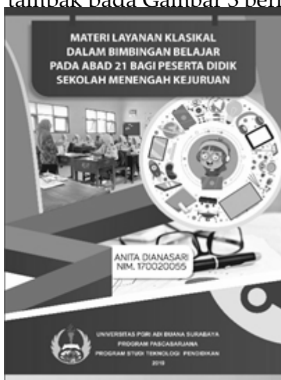
Gambar 3. Desain Cover Bahan Belajar

Selain mengembangkan bahan belajar, peneliti juga merancang instrumen penilaian bagi ahli materi (substansi), ahli desain pembelajaran, dan peserta didik sebagai pengguna ( end users ). Peranserta pengguna ini adalah dalam bentuk uji coba kelompok kecil dan uji coba lapangan. Cover bahan belajar yang sedang dikembangkan adalah seperti yang tampak pada Gambar 3 berikut ini.