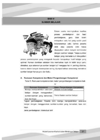
Gambar 4. Contoh Isi Bahan Belajar

Bahan belajar ini juga dilengkapi ilustrasi awal sebelum masuk pada materi pelajaran, terdapat catatan khusus untuk beberapa materi pelajaran penting yang dilengkapi dengan ringkasannya, dan butir-butir soal latihan untuk menguji pemahaman peserta didik setelah mempelajari bahan belajar ini. Adapun contoh bahan belajar materi pelajaran layanan klasikal dalam bimbingan belajar pada Abad 21 bagi peserta didik SMK pada bagian isi dapat dilihat pada Gambar 4 berikut ini.