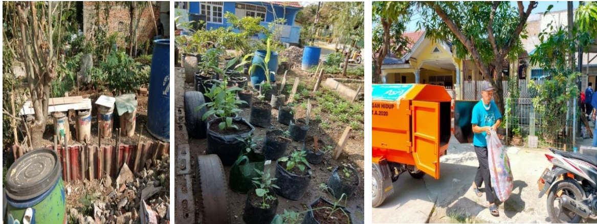
Gambar 2. Potret Kegiatan PkM

Kegiatan Pengabdian Kepada Masyarakat, tahapan yang dilalui sebagai berikut :