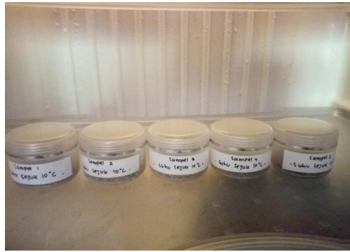
Gambar 3.2 Sampel Suhu Sejuk 10°C

Berdasarkan Tabel 3.3 hasil pengujian organoleptis sediaan yang meliputi bentuk, warna, bau, ada tidaknya jamur pada sediaan selama 3 minggu yang disimpan pada suhu ruang 25°C dan suhu sejuk 10°C. Pada suhu ruang dan suhu sejuk bentuk sediaan lulur serbuk tradisional biji pepaya ( Carica papaya L ) dan pati kedelai ( Glycine max L ) serbuk kasar, warna hitam kekuningan, serta tidak adanya jamur pada sediaan. Akan tetapi, pada pengamatan bau sediaan yang disimpan pada suhu ruang berubah pada hari ke-9 sampai hari ke-21 bau khas minyak zaitun melemah. Sedangkan, bau sediaan yang di simpan pada suhu sejuk tetap stabil dari hari ke-1 sampai hari ke-21 yaitu bau khas minyak zaitun.