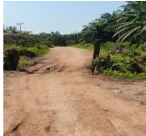
Gambar 2 Kondisi eksisting dilapangan

penelitian terletak di jalan Tanjung Kapal – Darul Aman Kecamatan Rupat Kabupaten Bengkalis sepanjang 11,2 km.