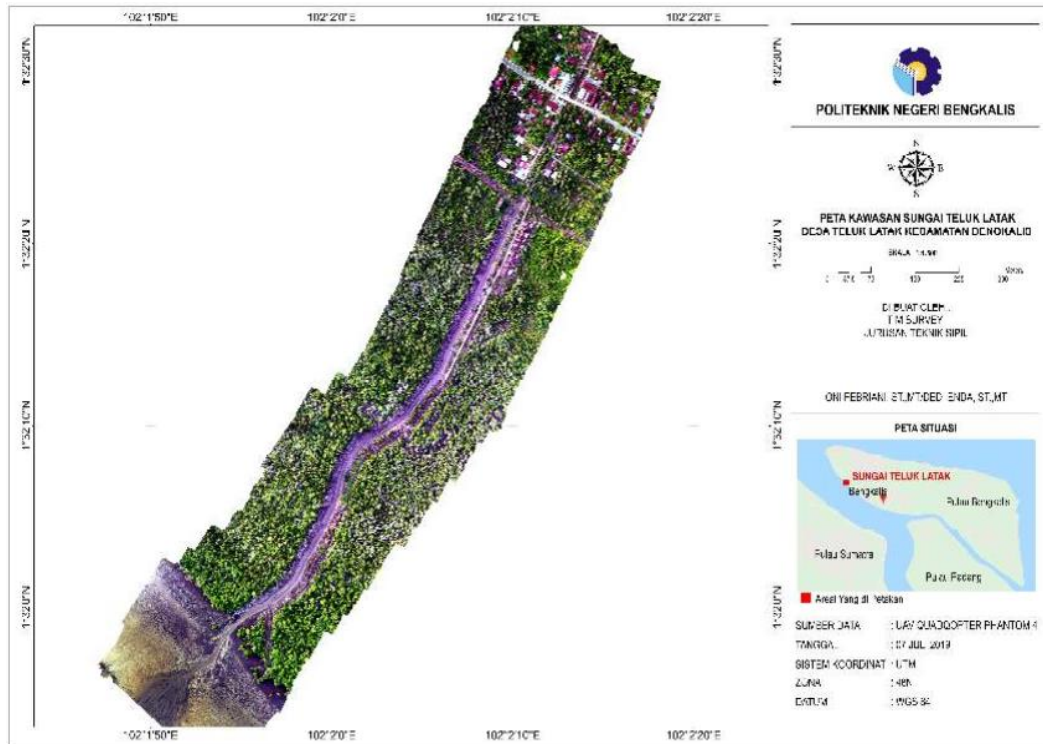
Gambar 2 Lokasi Sungai Simpang Baru Desa Teluk Latak Kecamatan Bengkalis, Riau