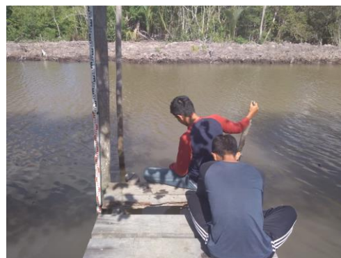
Gambar 5 Pengukuran Kecepatan aliran sungai

c. Pengukuran kecepatan aliran sungai Pengukuran kecepatan aliran dilakukan di tiga segmen yakni pangkal, tengah dan ujung sungai yang mengarah ke laut. Data tersebut diambil dengan metode pelampung sesuai dengan metode [3]