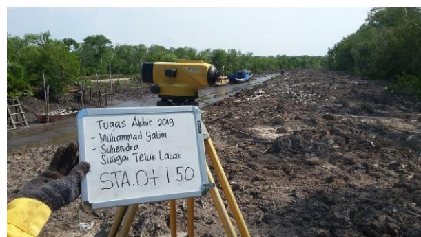
Gambar 3 Pengukuran Profil Melintang dan Memanjang Sungai

Adapun Langkah yang harus dikerjakan dalam memperoleh data primer adalah dengan melakukan pengukuran langsung menggunakan alat ukur waterpass. Berikut Langkah yang diambil dalam pengukuran lapangan per segmen nya adalah 50 meter sepanjang 1000 m menuju ke muara sungai.