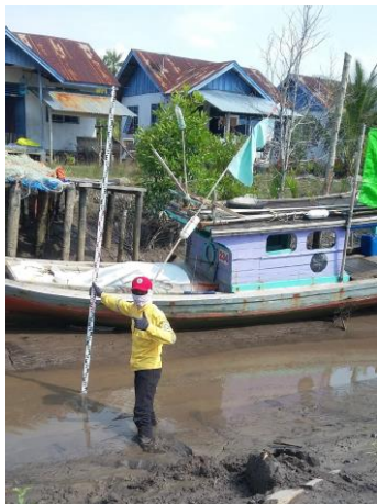
Gambar 4 Pengukuran profil muka air sungai