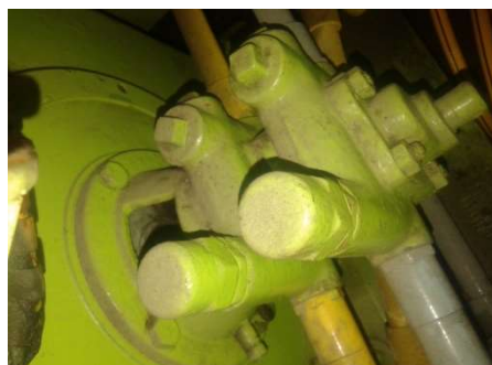
Gambar 8. Feed Pump

tekan pompa, sehingga jumlah minyak yang mengalir masuk ke dalam purifier mengalami penurunan volume.