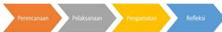
Gambar 2. Rencana Tindakan PTS

Adapun rencana tindakan yang dilakukan yaitu: (1) perencanaan, (2) pelaksanaan, (3) pengamatan, dan (4) refleksi.