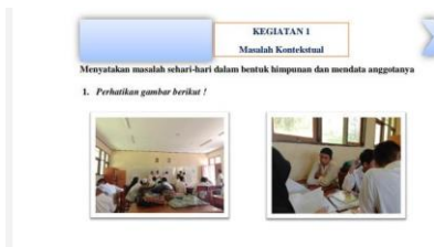
Gambar 1 Layout Bahan Ajar

Dari gambar diatas dapat dilihat bahwa dalam bahan ajar matematika berbasis RME, siswa dikenalkan dengan lingkungan sekitarnya ysnng termasuk dalam kehidupan sehari-hari. Dalam gambar diatas salah satunya adalah lingkungan kelas. Kelas merupakan lingkungan tempat belajar siswa . dari gambar tersebut dapat terlihat himpunan kelas diantaranya adalah meja ,bangku, papan tulis tas dan buku.