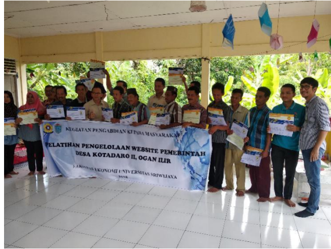
Gambar 3. Dokumentasi Kegiatan