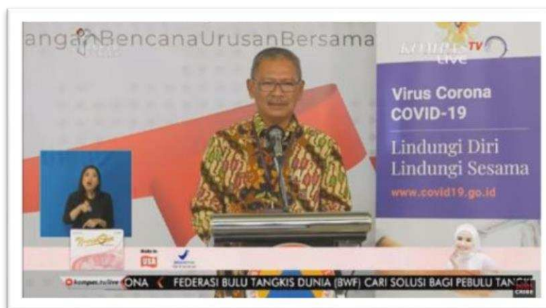
Contoh Siaran Pers melalui Televisi

jutaan viewers . Hal ini membuktikan bahwa sistem TV Pool dan Radio Pool yang diterapkan oleh tim Public Relations Gugus Tugas Covid 19 Republik Indonesia merupakan sistem yang efektif dan tepat untuk digunakan.