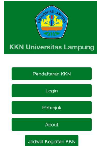
Gambar 2 Halaman Utama

Pada halaman utama terdapat menu Pendaftaran KKN, Login , Petunjuk , About dan Jadwal Kegiatan KKN . Jadwal Kegiatan KKN akan menampilkan popup yang berisi tanggal pendaftaran dan tanggal pelaksanaan KKN. Halaman utama dapat dilihat pada Gambar 2.