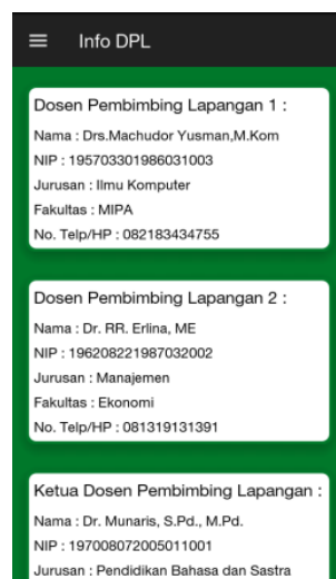
Gambar 4. Halaman Info Dosen Pembimbing Lapangan

Pada halaman info DPL terdapat beberapa informasi mengenai Dosen Pembimbing Lapangan dan Ketua Dosen Pembimbing Lapangan. Halaman info DPL dapat dilihat pada Gambar 4.