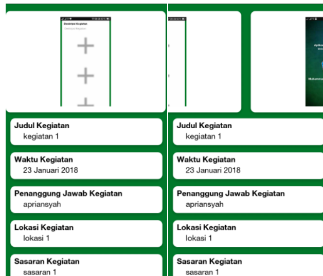
Gambar 6. Halaman Detail Laporan Kegiatan

Pada halaman ini merupakan isi lengkap dari laporan yang sudah dikirim sebelumnya dengan menampilkan 3 foto yang telah dikirim, nama kegiatan, waktu kegiatan dan lain-lain. Halaman detail laporan kegiatan dapat dilihat pada Gambar 6.