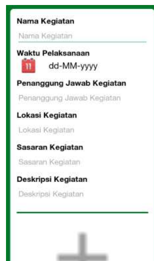
Gambar 5. Halaman Pembuatan Laporan

Pada halaman buat laporan, mahasiswa dapat mengirimkan laporan kegiatan harian dengan 3 buah foto dan keterangan lainnya. Halaman buat laporan dapat dilihat pada Gambar 5.