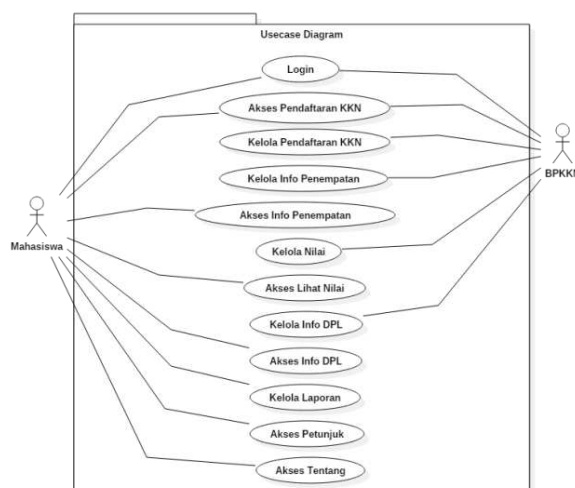
Gambar 1 Use Case Diagram

Use case diagram digunakan untuk menggambarkan sistem dari sudut pandang pengguna sistem tersebut (mahasiswa), sehingga pembuatan use case diagram ini lebih dititikberatkan pada fungsionalitas yang ada pada sistem, bukan berdasarkan alur atau urutan kejadian. Berikut use case diagram aplikasi KKN mahasiswa Universitas Lampung dapat dilihat pada Gambar 1.