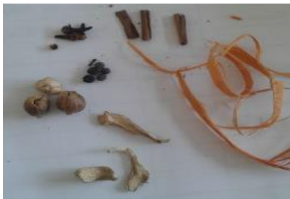
Gambar 3. Ramuan Secang di Desa Seloliman