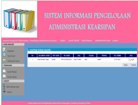
Gbr. 8 Tampilan Halaman Daftar Surat Masuk