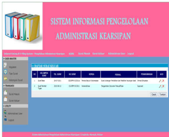
Gbr. 9 Tampilan Halaman Daftar Surat Keluar