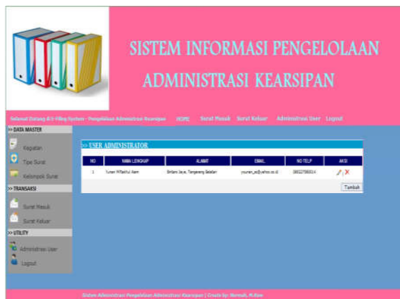
Gbr. 10 Tampilan Halaman Administrasi User