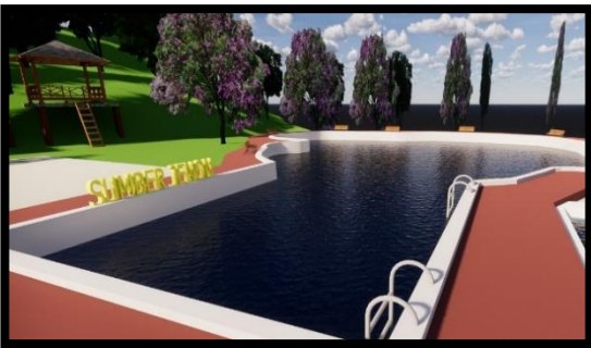
Gambar 6 Desain Kolam Sumber Air