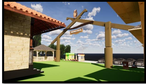
Gambar 8 Desain Gerbang Keluar Kawasan Sumber Air Jenon

Gerbang keluar dari pusat oleh-oleh dibuat langsung menuju ke parkir agar memudahkan pengunjung. Selain itu melihat kondisi eksisting lokasi parkir yang ada di Sumber Jenon yang cukup luas memungkinkan dapat menampung cukup banyak kendaraan roda dua dan kendaraan roda empat.