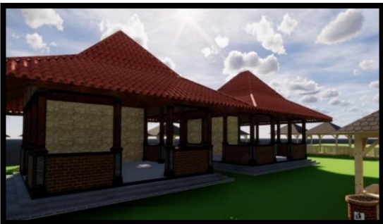
Gambar 7 Desain Pusat oleh-oleh

Penambahan pusat oleh-oleh Sumber Jenon ini diperuntukan untuk masyarakat Desa Gunungronggo dikarenakan masyarakat Desa Gunungronggo bisa menjual produk olahan khas yang bisa membantu perekonomian masyarakat. Selain itu di kawasan pusat oleh-oleh ini juga terdapat pendopo yang dapat digunakan apabila para pengunjung ingin istirahat setelah berbelanja. Pusat oleh-oleh ini dibuat menuju arah gerbang keluar sehingga apabila pengunjung ingin pulang pasti akan melewati pusat oleh-oleh ini.