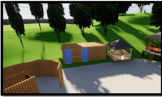
Gambar 5 Desain Kamar Mandi Umum