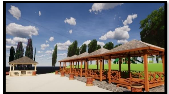
Gambar 3 Desain Pendopo dan Tempat Penyewaan Alat Renang

Jenon. Jadi ditambahkan pendopo pada sisi bagian kanan dan kursi santai di sekitar kolam. Selain itu pada ujung sisi kiri terdapat tempat penyewaan alat-alat renang seperti ban, pelampung dan alat selam