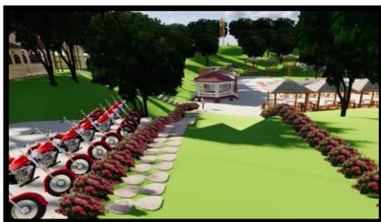
Gambar 2. Desain Gerbang Masuk Sumber Jenon

Sumber Jenon memang memiliki pintu masuk lalu perlu ditambahkan beberapa tanaman bunga disepanjang jalan menuju kolam. Dikarenakan jalan dari loket tiket menuju kolam agak curam sehingga dibagian sisi kanan ditambahkan anak tangga agar memudahkan pengunjung, tetapi dibagian sisi kiri tidak diubah dikarenakan mengantisipasi ada pengunjung yang membawa kereta bayi.