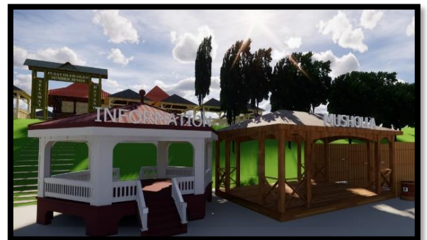
Gambar 4. Desain Bagian Informasi dan Mushola