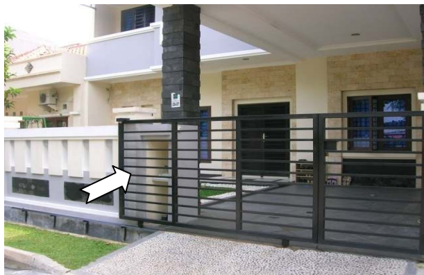
Gambar 3 – Kotak / Rumah Meteran PLN

Nasabah regular rumah tangga perlu membuat akses khusus kepada petugas pencatatan meteran, agar dapat mencatat dengan baik dengan cara bekerjasama dengan PLN untuk memindahkan meteran PLN ke daerah yang mudah dilihat oleh petugas dengan membuat kotak khusus atau rumah meteran PLN yang menyatu dengan pagar rumah, dengan pengamanan yang cukup untuk menghindari gangguan dari orang-orang yang tidak bertanggung jawab (Gambar 2).