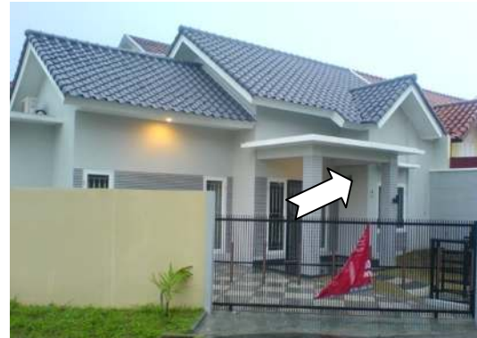
Gambar 1 – Meteran PLN di Rumah yang dibatasi Pagar