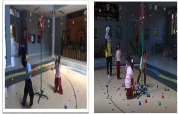
Gambar 7. Anak bermain bola keranjang

Pada saat berkeliling guru juga memberikan motivasi, mengamati dan mendokumentasikan perkembangan anak, guru tidak lupa mengingatkan anak dengan cara memberitahukan kepada anak, 5 menit sebelum kegiatan bermain usai