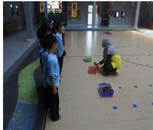
Gambar 1. Pijakan lingkungan main

Pijakan Lingkungan Main dimulai pukul 09:30-09:50 WIB, pada pijakan lingkungan main guru mempersiapkan media dan alat main yang akan digunakan dalam kegiatan sesuai dengan RPPH, selanjutnya guru menata media dan alat bermain di lapangan. Adapun gambar penataan lingkungan main seperti di bawah ini: