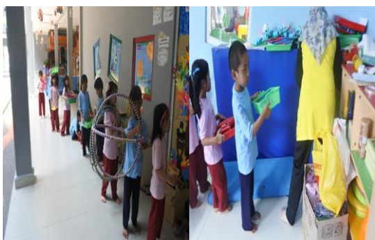
Gambar 11. Anak beres-beres alat dan media

Pukul 10:45-11:00 yang dilakukan guru pada saat itu adalah recalling, guru bertanya apa yang sudah dibuat dan membiarkan anak bercerita kegiatan apa saja yang sudah dilakukan. Setelah waktu bermain habis guru menginformasikan kepada anak-anak untuk melakukan beres-beres mengembalikan membereskan alat dan media bermain, dikembalikan ke ruang sentra Olah Tubuh lalu dilanjutkan dengan membaca doa dan pulang.