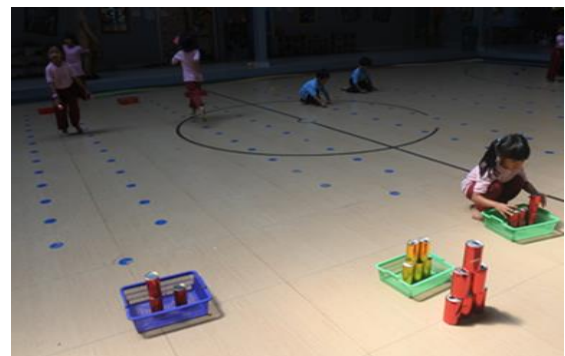
Gambar 9. Anak Bermain Menyusun Menara