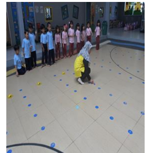
Gambar 4. Saat menjelaskan bermain katak melompat