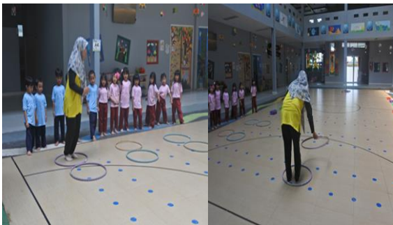
Gambar 6. Saat menjelaskan bermain hula hop

Pada kegiatan keempat yang dijelaskan oleh guru adalah Permainan Ketangkasan Hulahup. Pada permainan ini guru menjelaskan bahwa permainan Ketangkasan Hulahup dimainkan 3 orang. Cara permainan ini adalah setiap anak mempunyai 2 hulahup. Anak-anak masuk ke dalam lingkaran hulahup pertama lalu hulahup kedua dipindahkan ke depan, selanjutnya anak melompat berpindah ke hulahup depan, diulangi hingga mencapai garis finish.