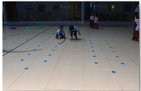
Gambar 8. Anak Bermain Lompat Katak