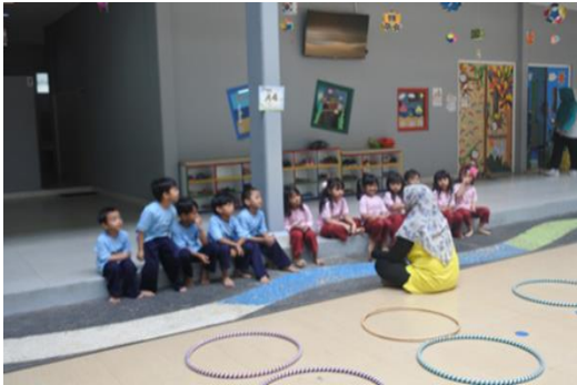
Gambar 2. Pijakan sebelum main

memilih teman bermain berdua sampai bertiga. Setelah itu anak boleh langsung bermain.