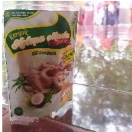
Gambar 5. Packing produk kripik kelapa Desa Sadah

Kebermanfaatn dari program kegiatan ini adalah untuk mengetahui bahwa adanya produk keripik kelapa tersebut dapat dijadikan sebagai upaya pemulihan ekonomi pasca bencana di desa Sadah. Semula buah kelapa yang tidak dimanfaatkan secara maksimal dan hanya dijadikan sebagai santan, tetapi sekarang bisa dijadikan olahan keripik kelapa yang salah satunya dapat meningkatkan pendapatan masyarakat desa Sadah.