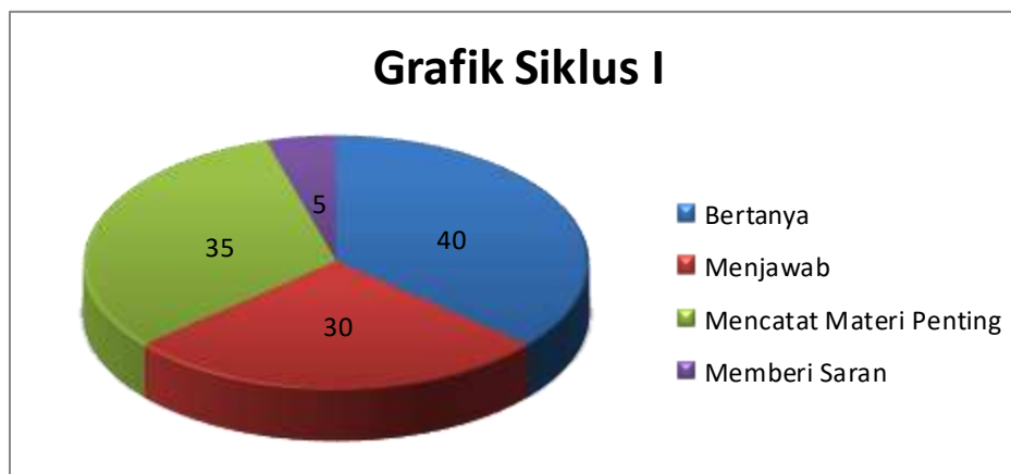
Grafik 1 : siklus I

Siklus pertama pertemuan pertama aktifitas memberikan saran hanya 1 orang, (5%) Jadi Siklus I Hasil rata-ratanya dapat di lihat grafik dibawah ini sebagai berikut: