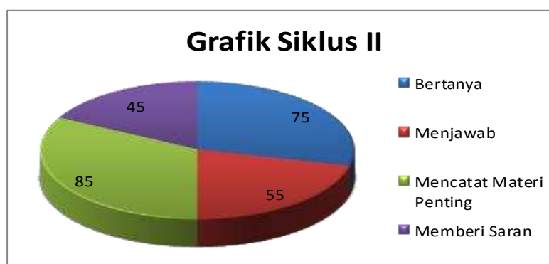
Grafik 2. Siklus II

Siklus II aktifitas siswa untuk memberikan saran 9 orang, (45%)