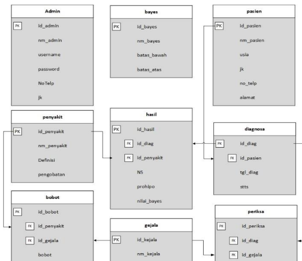
Gambar 3. Relasi Antar Tabel

Perancangan database dapat dilihat pada Gambar 3.