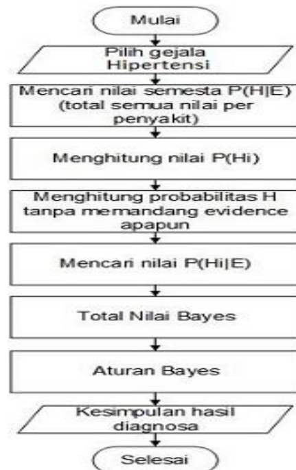
Gambar 4. Flowchart Sistem