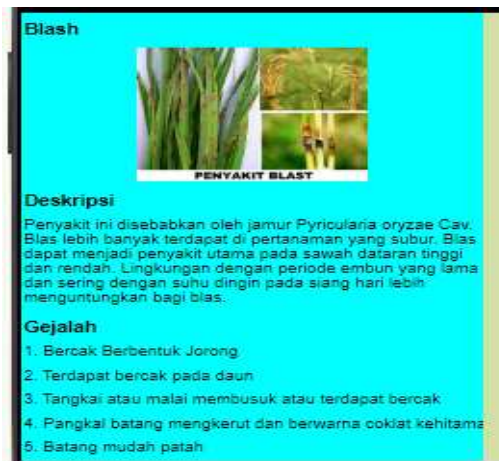
Gambar 6. Tampilan Data Hasil Penelusuran

Tampilan data menu penyakit merupakan data hasil peneusuran pengguna yang akan memunculkan nama penyakit atau hama tergantung pilihan pengguna, deskripsi, gejala hingga pengendaliannya.