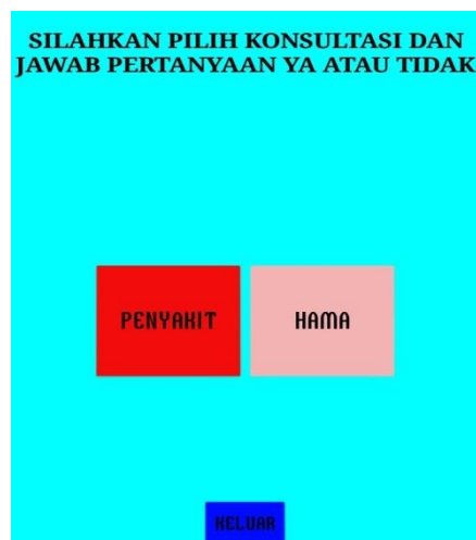
Gambar 5. Tampilan Menu Konsultasi

Pada tampilan menu konsultasi adalah bagian tampilan dimana pengguna akan di tujukan untuh memilih salah satu konsultasi yang ingin digunakan kemudian setelah itu aplikasi akan menampilkan hasil konsultasi yang telah di pilih pengguna.