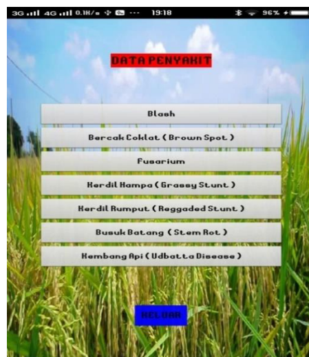
Gambar 3. Tampilan Data Menu Penyakit

Tampilan data penyakit merupakan bentuk penelusuran atau pencarian penyakit tanaman padi sehingga dapat menampilkan Jenis jenis penyakit tanaman padi.