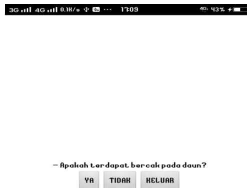
Gambar 7. Tampilan Peertanyaan Konsultasi

Dalam tampilan ini menampilkan pertanyaan yang sesuai dengan konsultasi yang kita pilih