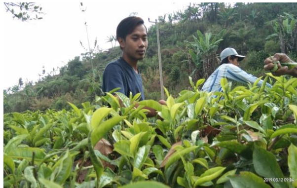
Gambar 2. Kebun Teh

Sekalipun terdapat berbagai obyek wisata dan perkebunan harapannya dapat terintegrasikan antar obyek wisata yang ada di desa payung. Adanya perpaduan antara obyek wisata yang berbasis air dengan hasil bumi seperti teh. Sehingga dapat dijadikan keunggulan desa guna mempromosikan ke masyarakat secara umum. Perkebunan teh desa payung memiliki potensi yang sangat besar bagi masyarakat sekitar.