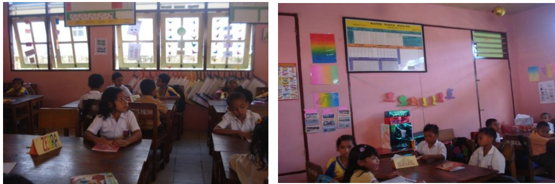
Gambar 3. Pajangan Hasil Kerja Siswa (Portofolio)

Dengan begitu siswa bisa lebih aktif dalam pembelajaran karena siswa akan lebih banyak bekerja secara kooperatif, (b) Siswa merasa nyaman belajar di kelasnya karena kelasnya menarik dan menyenangkan sebab lingkungan kelasnya menarik. Begitu pun dengan hasil karya siswa dihargai dan dipajang di dalam kelas, (c). Dalam pembelajaran guru mempergunakan sumber belajar yang lebih beragam (media sederhana yang rendah biaya), seperti pohon ilmu yang dibuat bersama-sama dengan oleh guru dan siswa, Guru sebagai fasilitator bagi siswanya. Dalam kegiatan belajar mengajar, antusias dan kehangatan guru selalu ditunjukkan. Hasil penelitian menunjukkan, ketika guru menerapkan pengelolaan kelas yang baik, siswa kelas III menunjukkan sikap positif disiplin. Beberapa sikap positif disiplin siswa yang ditunjukkan secara mandiri antara lain. Pertama, siswa bertanggung jawab dengan tugas harian. Tanpa harus diperintah oleh guru, siswa telah menyadari tanggung jawabnya sebab di kelasnya tersedia media untuk tugas harian. Dapat dilihat pada gambar 3.