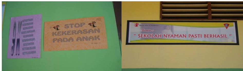
Gambar 1. Sikap Positif Siswa di Sekolah

Gambar 1 menjelaskan bahwa SD Negeri 41 Ambon dalam mengembangkan sikap positif disiplin terhadap siswa tidak melakukan kekerasan, melainkan melalui pengelolaan kelas yang baik. Sekolah lebih mengedepankan rasa nyaman bagi siswanya.