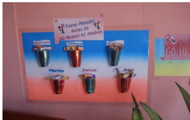
Gambar 4. Menunbuhkan Sikap Positif Melalui Kebersihan Kelas

Dengan begitu siswa bisa lebih aktif dalam pembelajaran karena siswa akan lebih banyak bekerja secara kooperatif, (b) Siswa merasa nyaman belajar di kelasnya karena kelasnya menarik dan menyenangkan sebab lingkungan kelasnya menarik. Begitu pun dengan hasil karya siswa dihargai dan dipajang di dalam kelas, (c). Dalam pembelajaran guru mempergunakan sumber belajar yang lebih beragam (media sederhana yang rendah biaya), seperti pohon ilmu yang dibuat bersama-sama dengan oleh guru dan siswa, Guru sebagai fasilitator bagi siswanya. Dalam kegiatan belajar mengajar, antusias dan kehangatan guru selalu ditunjukkan. Hasil penelitian menunjukkan, ketika guru menerapkan pengelolaan kelas yang baik, siswa kelas III menunjukkan sikap positif disiplin. Beberapa sikap positif disiplin siswa yang ditunjukkan secara mandiri antara lain. Pertama, siswa bertanggung jawab dengan tugas harian. Tanpa harus diperintah oleh guru, siswa telah menyadari tanggung jawabnya sebab di kelasnya tersedia media untuk tugas harian. Dapat dilihat pada gambar 3.