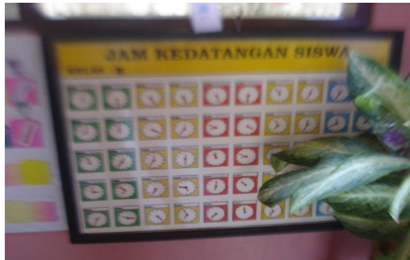
Gambar 5. Belajar Mengatur Waktu di Sekolah

Ketiga, siswa sangat tertib ketika harus ijin ke kamar kecil/toilet. Siswa tidak harus diatur oleh guru ketika ke kamar kecil tetapi dengan kartu ijin, siswa belajar untuk tertib dengan penuh kesadaran diri. Diperlihatkan dalam gambar berikut.