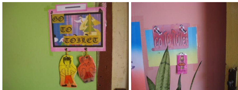
Gambar 6. Sikap Positif Melalui Kartu Ijin Ke Toilet

Ketiga, siswa sangat tertib ketika harus ijin ke kamar kecil/toilet. Siswa tidak harus diatur oleh guru ketika ke kamar kecil tetapi dengan kartu ijin, siswa belajar untuk tertib dengan penuh kesadaran diri. Diperlihatkan dalam gambar berikut.