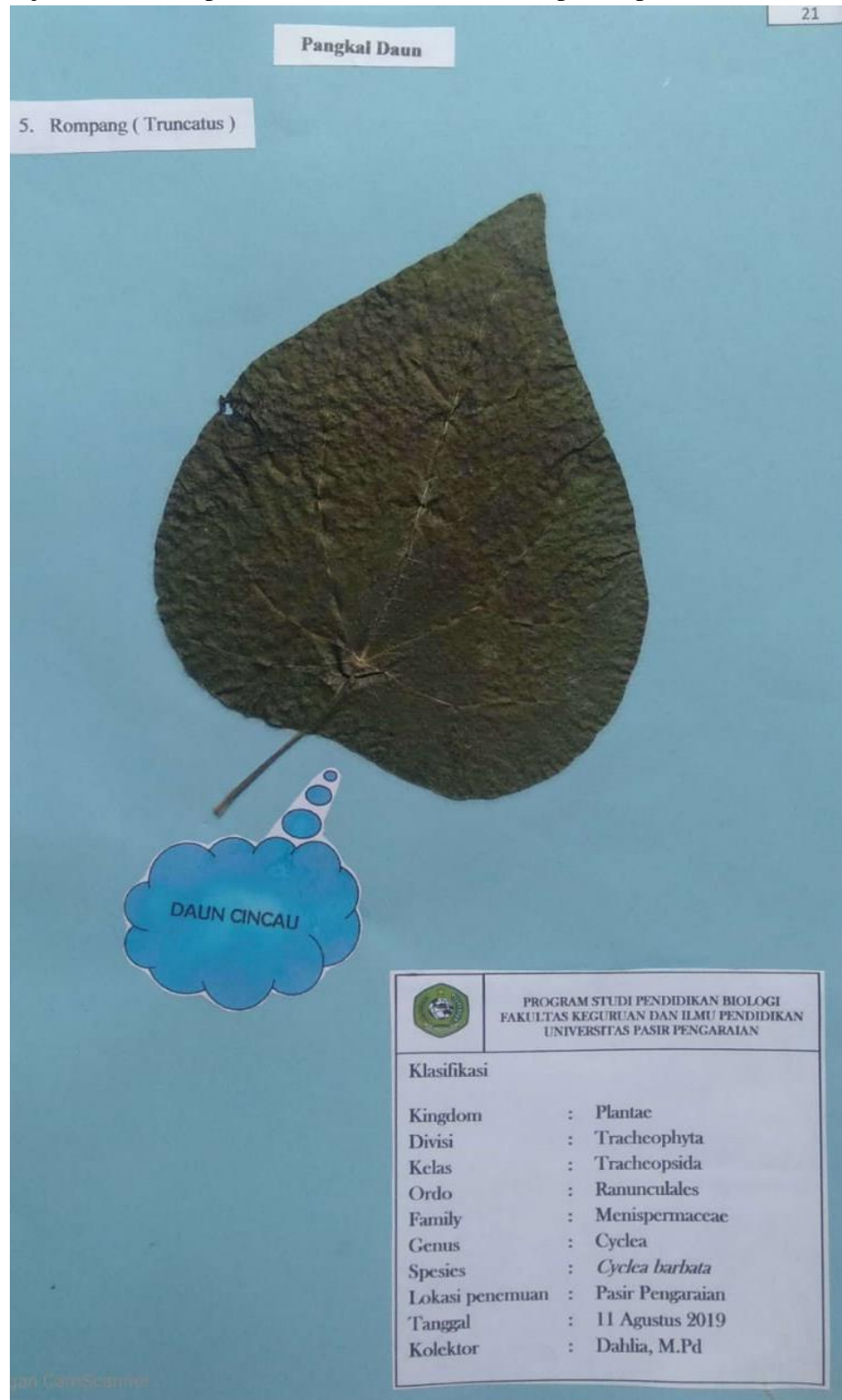
Gambar 3. Contoh Tampilan Isi Herbarium Book

Lebih lanjut, contoh tampilan isi herbarium book ditampilkan pada Gambar 3.