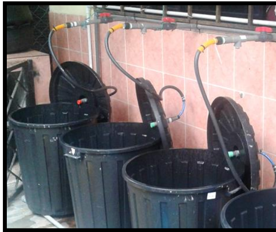
Rajah 4. Tong pencambah tauge yang telah siap dan sedia untuk digunakan