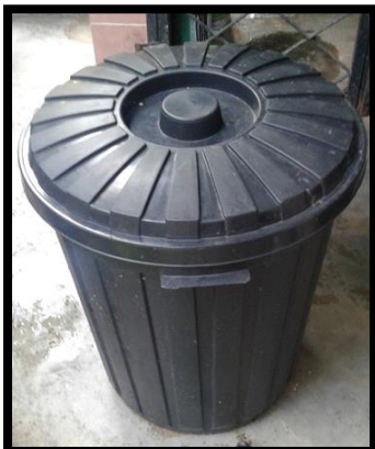
Rajah 1. Tong pencambah tauge