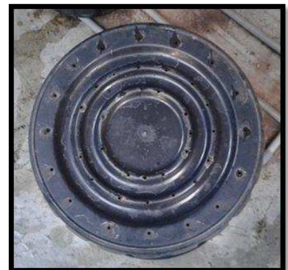
Rajah 3. Lubang tong pencambah