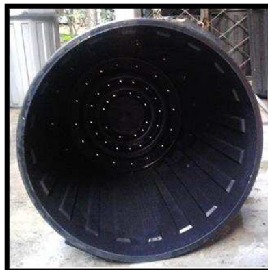
Rajah 2. Lubang tong pencambah