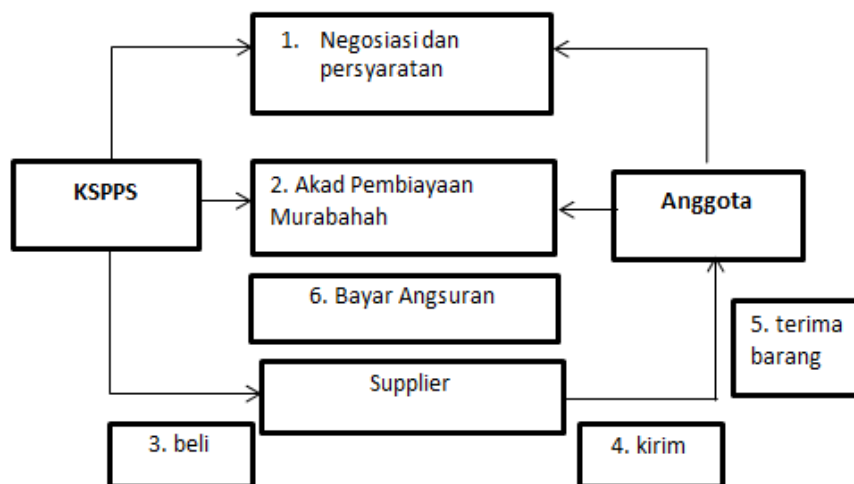
Gambar 1 Skema Pembiayaan Syariah