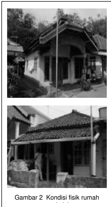
Gambar 2 Kondisi fisik rumah

Kondisi bangunan pada lokasi penelitian sebagian besar sudah bersifat permanen dengan menggunakan material dari bahan batu bata dan kayu. Sedangkan untuk bahan penutup lantai terbuat dari keramik dan plesteran semen. Sifat bahan akan sangat menentukan dalam terciptanya tingkat kenyamanan di dalam bangunan, kemampuan bahan dalam merespon kondisi lingkungan luar harus sesuai, apakah bahan tersebut dapat cepat melepas dan menyerap panas atau lambat dalam menyerap dan melepas panas, hal ini tergantung pada konstruksi dari bahan tersebut. Semakin tebal dan padat konstuksi suatu bahan, maka semakin lambat dalam merespon kondisi lingkungan. Dengan pemilihan material bangunan yang terbuat dari bahan permanen diharapkan mampu mempertahankan kondisi termal bangunan agar tidak mudah terpengaruh kondisi udara di luar rumah dengan temperatur udara yang lebih rendah dan kelembaban udara yang tinggi.