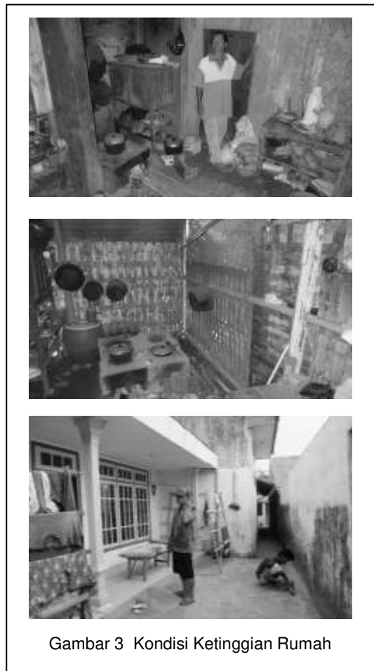
Gambar 3 Kondisi Ketinggian Rumah

Pada rumah-rumah di daerah Kecamatan Poncokusumo pada umumnya memiliki jarak antara lantai dengan plafond yang tidak terlalu tinggi, dengan ketinggian maksimal 3 m. Hanya sedikit rumah penduduk yang memiliki ketinggian jarak antara plafond dan lantai rumah yang lebih dari 3 m. Aktifitas para ibu di dalam ruangan dapur dengan rentang waktu yang cukup panjang, yaitu mulai bangun tidur pagi sampai dengan siang hari menyebabkan udara panas yang dihasilkan dari tungku di dapur terperangkap di dalam rumah sampai saat malam hari. Sensasi udara yang dihasilkan dari tungku dapur sebagai akibat dari kondisi itu membuat sensasi udara hangat di dalam rumah yang menjadikan kenyamanan termal di dalam rumah dapat dinikmati oleh seluruh anggota keluarga ketika saatnya mereka beraktifitas di dalam rumah.