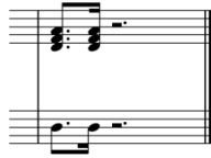
Notasi 12. Pefack Authentic Cadens Dalam Komposisi Tale Mangko