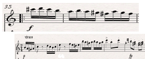
Notasi 4 Dinamik Forte (f) , Piano (p) , forte Piano (fp) Dalam Komposisi Rondo Allaturca

forte atau " f " yaitu nada atau ritme dimainkan dengan keras dan tegas, lambang tersebut terdapat pada birama 35. (2) piano atau " p " yaitu nada atau ritme dimainkan dengan lembut, lambang tersebut terdapat pada birama 1. (3) forte piano atau " fp " yaitu nada atau ritme dimainkan dengan keras-lembut, lambang tersebut terdapat pada birama 6. Lambang-lambang yang dimaksud dapat dilihat pada potongan melodi Komposisi Rondo Allaturca seperti di bawah ini.