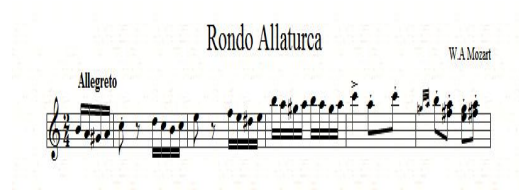
Notasi 1 Gerakan Intro Berbentuk Makro Pada Komposisi Rondo Allaturca

Gerakan pertama dari komposisi Rondo Allaturca di awali oleh sebuah intro dalam tempo Allegretto, dan memakai key signature (natural) dengan sukut 2/4. Gerakan intro ini berbentuk makro, seperti yang tertulis pada potongan melodi di bawah ini.