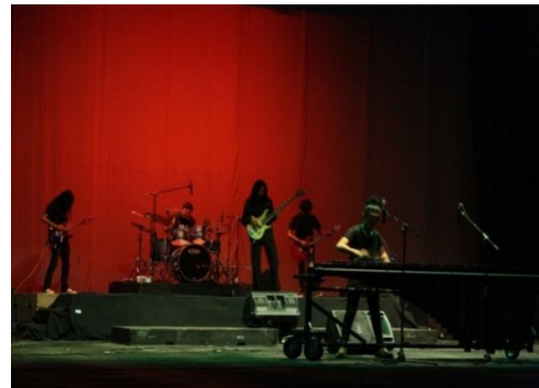
Foto 1 Solis Marimba

Oleh karena Rondo Allaturca merupakan karya musik zaman Baroq, maka ia mempunyai ciri umum musik pada era barok antara lain: (a) menggunakan dua peralihan dinamik forte atau " f " dan piano atau " P ", (b) perubahan tempo dengan perlambatan atau ritardando pada birama terakhir. Disamping itu (c) banyak terdapat nada hias atau ornament ,(d) karakter nada yang dihasilkan cemerlang, megah dan tegas, dan disertai lambang crescendo yang artinya semakin keras.