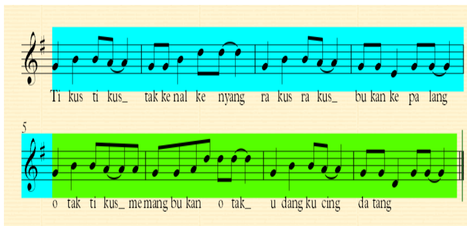
Gambar 2 Penggalan Notasi Reff Lagu “Tikus-Tikus Kantor”

Dari ilustrasi notasi tersebut dapat kita lihat bahwa struktur melodi tersebut sangatlah sederhana yaitu hanya berupa antecedens dan consequen . Antecedens adalah frase kalimat tanya, sedangkan consequen adalah frase kalimat penyelesaian/kalimat jawab. Kalimat yang dimaksud di sini adalah kalimat musikal yakni kalimat melodinya bukan kalimat lirik/bahasa. Ilustrasi melodi di atas memiliki dua bagian yang penulis bedakan dengan warna yakni warna biru muda dan hijau, di mana melodi yang diberi warna biru muda merupakan antecedens dan warna hijau merupakan consequen . Antara antecedens dan consequens tersebut bersifat simetris, seperti yang bisa kita lihat pada notasi di atas keduanya hanyalah berupa ulangan tanpa variasi. Perbedaannya hanya terletak pada birama terakhir yang jatuh di nada do untuk menyelesaikan kalimat musikalnya/sebagai consequen .