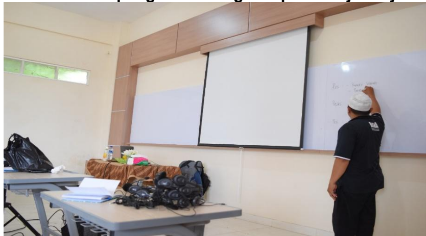
Gambar 2 Pemateri memberi pengantar mengenai pembelajaran jarak jauh

Produk yang dihasilkan dalam kegiatan ini berupa pengetahuan kepada guru-guru dan musyrif di Islamic Boarding School Al Hamra Malang mengenai pembelajaran jarak jauh. Ketika para peserta melakukan praktek, para pemateri mendampingi peserta dalam pelaksanaannya. Hampir secara keseluruhan para peserta tidak mengalami kesulitan dalam mempraktekkan materi yang sudah disampaikan sebelumnya. Beberapa peserta yang masih kesulitan, langsung diajarkan oleh pemateri supaya tidak kesulitan lagi. Untuk selanjutnya, para guru dan musyrif akan langsung mempraktekkan hasil seminar dan workshop ke peserta didik mereka masing-masing. Untuk proses pelaksanaan pengabdian bisa dilihat pada Gambar 2 – Gambar 6 berikut.