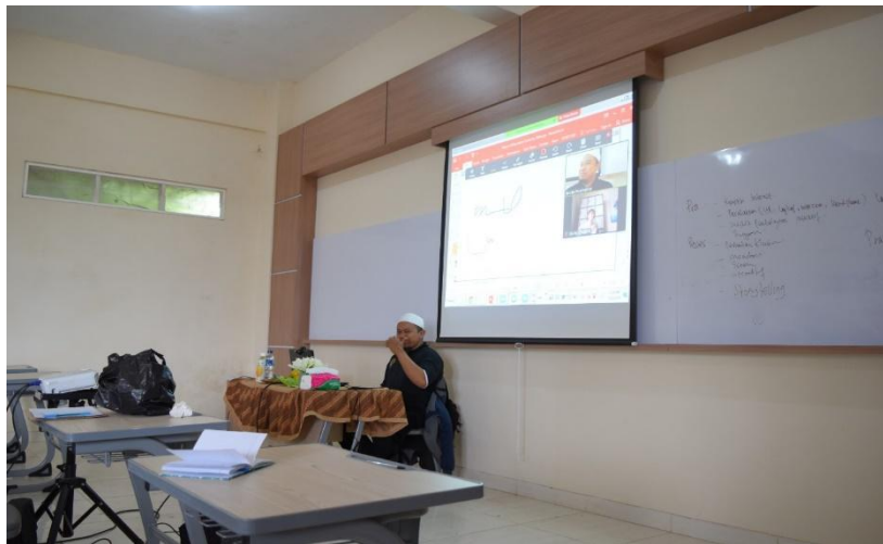
Gambar 4 Pemateri menyampaikan materi