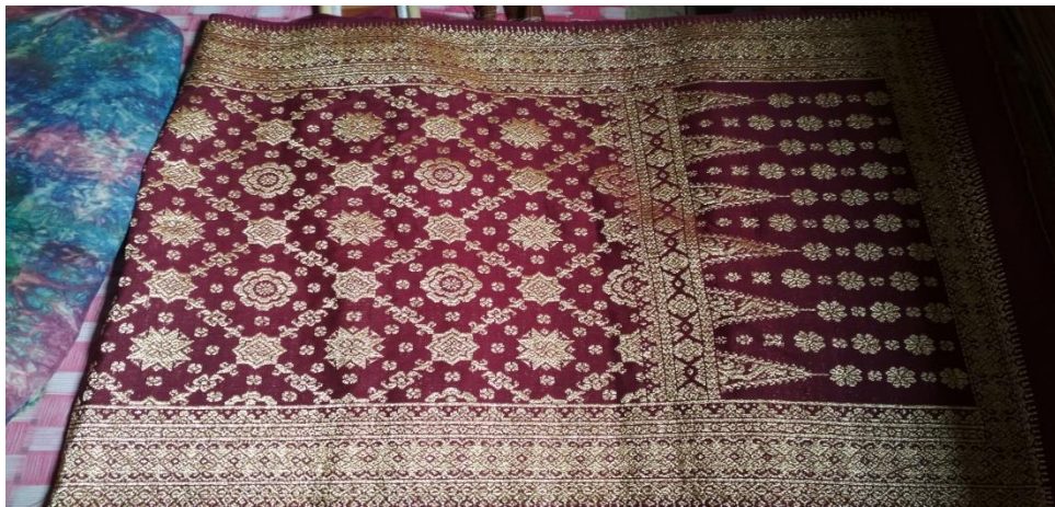
Gambar 9 Hasil Pembuatan Kain Tenun Songket Khas Palembang