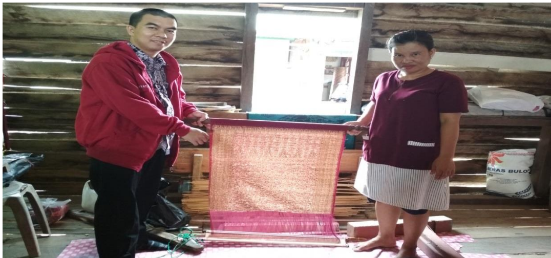
Gambar 7 Hasil Pembuatan Kain Tenun Songket