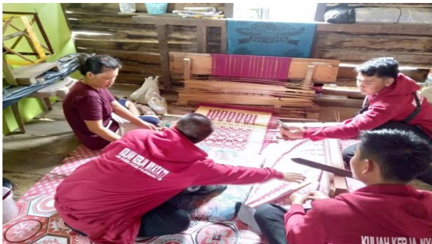
Gambar 5 Penjelasan Bahan-bahan dalam Pembuatan Kain Songket