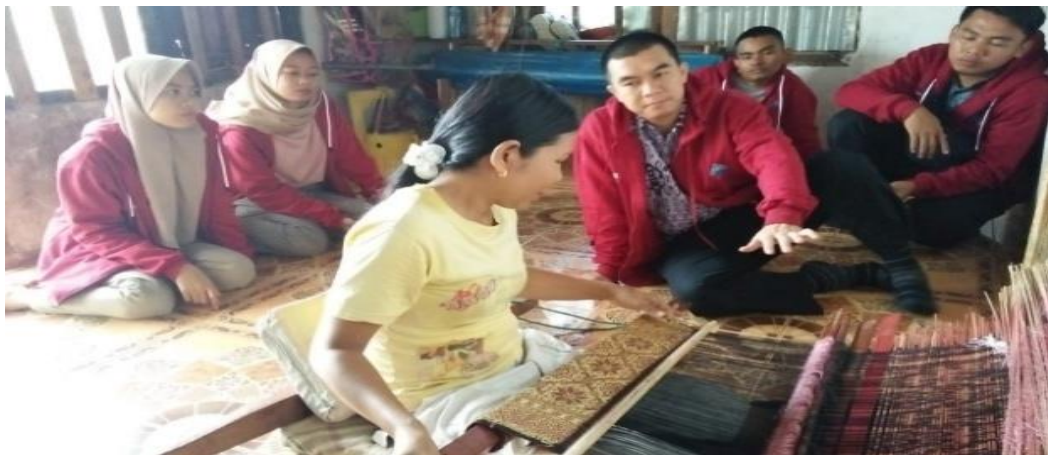
Gambar 1 Proses Pembuatan Kain Tenun Songket