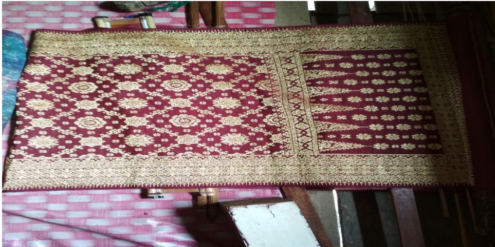
Gambar 8 Hasil pembuatan Kain tenun Songket