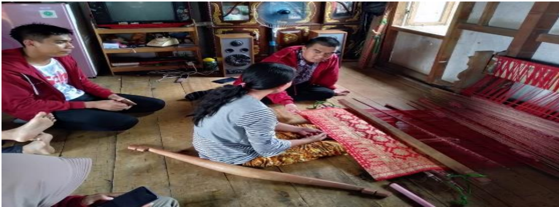
Gambar 2 Proses Pembuatan Kain Tenung Songket