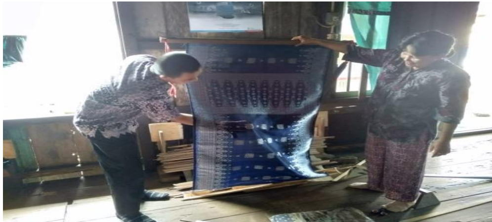
Gambar 4 Hasil Kain Tenun Songket Motif Silver