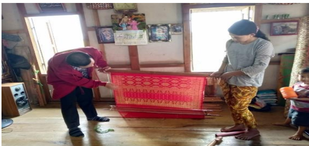
Gambar 3 Hasil Kain Tenun Songket Motif Mawar

Pengorganisasian adalah keseluruhan proses pengelompokkan orang, alat-alat, tugas-tugas, tanggung jawab, dan wewenang sedemikian rupa sehingga tercipta suatu organisasi yang dapat digerakkan sebagai suatu kesatuan dalam rangka mencapai tujuan yang telah ditentukan. Sehingga pengorganisasian adalah penyusunan dan pembagian tugas kepada masing-masing anggota di dalam suatu kelompok untuk mencapai tujuan yang telah ditentukan sebelumnya. Hasil dari pengamatan peneliti tentang pengorganisasian terdapat beberapa pembagian dalam proses pembuatan kain tenun songket tersebut diantaranya dalam hal fungsi masing-masing peralatan tenun diantaranya pelipiran (pembatas benang atas dan benang bawah), beliro (untuk memadatkan benang-benang yang sudah disusun), apet (sebagai tempat kain jadi yang sudah di tenun), por (untuk menopang badan bagian belakang pengerajin), gon pocok (pembatas benang atas), gon bawah (pembatas benang bawah), sisir (merapikan benang), lidi (pembatas antara benang satu dengan yang lainnya), dan jiplakan kembang (sebagai pola dalam membentuk pola kembang pada kain songket).