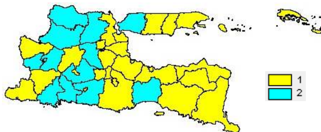
Gambar 2. Pengelompokan Berdasarkan Variabel yang Signifikan dengan Model GWNBR

Hasil pengelompokan pertama menunjukkan bahwa variabel angka partisipasi sekolah ( X_4 ) dan variabel pengeluaran per kapita ( X_{12} ) yang berpengaruh signifikan terhadap model untuk 25 kabupaten/kota di Jawa Timur. Sedangkan pada pengelompokan kedua hanya terdapat satu variabel yang signifikan terhadap model yaitu variabel angka partisipasi sekolah. Kelompok kedua berisikan 13 kabupaten/kota di Jawa Timur. Pengelompokan wilayah kabupaten/kota di Jawa Timur berdasarkan variabel yang signifikan disajikan dalam Gambar 2.