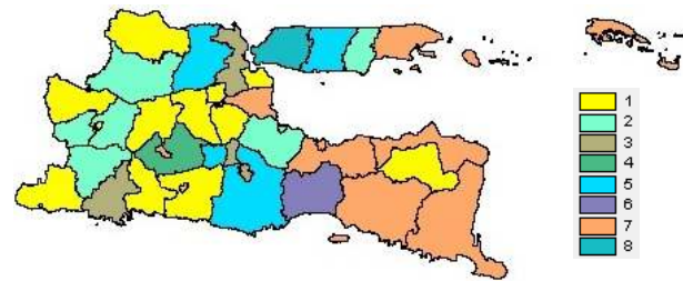
Gambar 3. Pengelompokan Berdasarkan Variabel yang Signifikan dengan Model GWPR