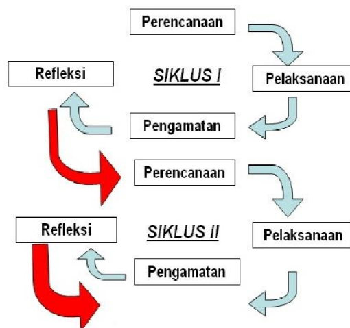
Gambar 1. Bagan Prosedur Penelitian Tindakan Kelas

Adapun alur pelaksanaan tindakan dapat dilihat dari gambar 1 sebagai berikut: