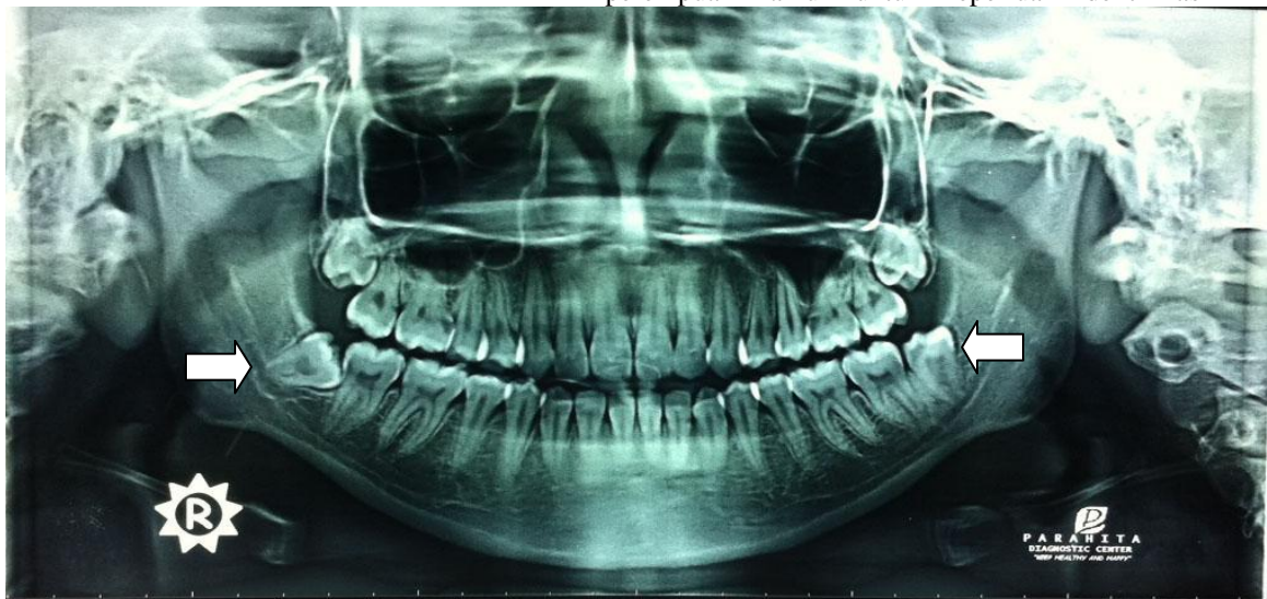
Gambar 2. Contoh foto panoramik sampel yang memperlihatkan gigi molar tiga kiri dan kanan

Usia dental gigi molar tiga kiri bawah pada sampel laki – laki mempunyai rata – rata sebesar 20,67, sedangkan rata – rata sampel perempuan yaitu sebesar 19,94 dengan selisih 0,73 tahun, dari hasil uji komparasi tidak ada perbedaan bermakna antara usia dental gigi molar tiga kiri bawah laki – laki dan perempuan yaitu dengan nilai p sebesar 0,904. Sedangkan, usia dental gigi molar tiga kanan bawah pada sampel laki – laki mempunyai rata – rata sebesar 20,62 tahun dan untuk rata – rata sampel perempuan yaitu sebesar 20,25 tahun dengan selisih hanya 0,37 tahun dan dari hasil uji komparasi tidak ada perbedaan bermakna pula dengan p sebesar 0,568. Hal ini berarti usia dental berdasarkan metode Demirjian yang dimodifikasi dapat dipakai pada sampel laki – laki maupun perempuan namun untuk keperluan identifikasi