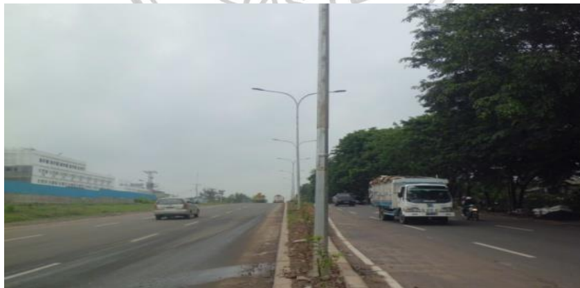
Gambar 1. Keadaan Jalan Soekarno Hatta