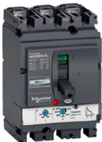
Gambar 4. Contoh sebuah MCCB

Untuk MCCB dengan kapasitas tetap, maka MCCB tersebut akan bekerja hanya pada kapasitas yang tertera pada nameplate MCCB tersebut, sedangkan untuk MCCB dengan kapasitas yang bervariasi, maka kapasitas kerja MCCB dapat di setting sesuai dengan nilai antara yang tertera pada nameplate MCCB tersebut.