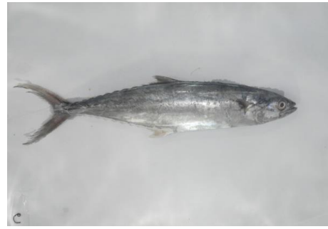
b. Citra 6 jam pertama