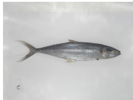
d. Citra 6 jam ke-3

Gambar 2. Hasil Citra menurut perubahan waktu Pengambilan.