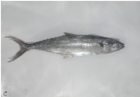
a. Citra 0 jam

Besarnya media pengambilan citra berdasarkan tabel 1 : tinggi 76 cm, lebar 50 cm, panjang 100 cm. Untuk mendapatkan citra yang baik berbagai langkah dilakukan terutama menyangkut aspek pencahayaan ( lighting ) citra yang dihasilkan dari hasil pencahayaan yang optimal dapat mempengaruhi nilai tekstur dari hasil ekstraksi citra.