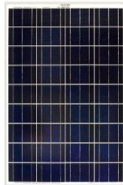
Gambar 5 Solar Panel

kristal silikon. Untuk koneksi listrik antar solar panel harus terpasang secara seri. Modul elektrik di solar panel dibuat berdasarkan kebutuhan. Untuk membuat modul dengan tegangan output sesuai dengan kebutuhan maka modul elektrik solar panel akan dibuat seri. Sedangkan untuk membuat modul elektrik yang bisa mengatur arus modul elektrik pada solar panel akan dibuat paralel. [5]