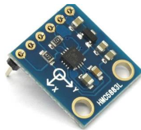
Gambar 3 Bentuk Fisik Sensor kompas HCM5883L

Sensor kompas HCM5883L adalah sensor digital pengukuran 3 sudut magnetoresistensif sensor. Sensor ini berukuran kecil, konsumsi daya rendah, akurasi bagus dan berulang, dan toleransi guncangan yang kuat dikuti harga yang terjangkau. Spesifikasi sensor kompas HMC588L[4]