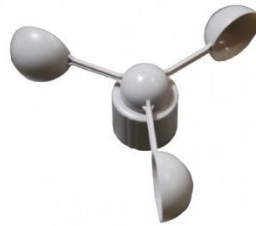
Gambar 2. Cup Anemometer.

berputar mangkuknya secara horizontal, putaran ini akan mengukur kecepatan angin dengan perbandingan antara banyaknya putaran dan interval waktu. [2]