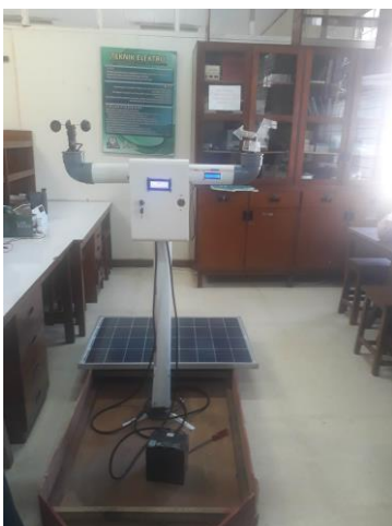
Gambar 6. Bentuk fisik dari perangkat navigasi arah angin, arah kapal, dan kecepatan angin untuk nelayan tradisional.

Pada Gambar 6 dapat dilihat bentuk fisik dari perangkat navigasi arah angin, arah kapal, dan kecepatan angin untuk nelayan tradisional. Sistem tersebut dibagi menjadi dua bagian yaitu anemometer dan arah kapal, serta pembaca arah angin. Pada sistem anemometer dan arah kapal menggunakan anemometer SKU SEN0170 sebagai sensor kecepatan angin dan HCM5883L sensor kompas digital sebagai pembaca arah kapal. Data yang didapat dari dua sensor tersebut diolah Arduino Uno data yang diolah ini ditampilkan pada LCD 20x4. Sistem kedua yaitu pembaca arah angin, sistem ini memanfaatkan sensor digital kompas HCM5883L untuk membaca dari mana arah angin datang sensor ini kemudian dipasang pada penunjuk angin. Untuk menghubungkan sensor HCM5883L dengan Arduino Uno digunakan slip ring, slip ring bertugas sebagai konektor yang bisa berputar 360° tanpa merusak kabel. Data yang didapat oleh sensor HCM5883L diproses Arduino Uno, data yang telah diproses Arduino Uno akan ditampilkan pada LCD 16x2. sebagai Sumber daya pada kedua sistem ini menggunakan baterai 13 V 23Ah. Baterai tersebut bisa di isi dayanya dengan menggunakan solar panel.