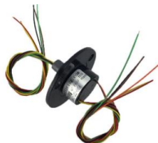
Gambar 4 Bentuk Fisik Slip Ring

Slip ring adalah komponen elektronika yang berfungsi untuk mengatasi sambungan elektrik yang memerlukan rotasi 360° berputar secara penuh, slip ring digunakan pada peralatan elektronik mekanik seperti motor sealing, radar, mikroskop, turbin angin, dan masih banyak lagi. [5]