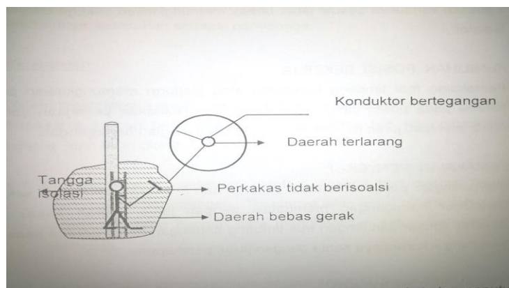
Gambar 1. Ilustrasi Daerah Terlarang

Daerah terlarang bagi pelaksana adalah daerah dimana pelaksana tidak dapat masuk tanpa sesuai dengan tingkatan dan hanya dapat memasukkan perkakas atau peralatan yang sesuai dengan pekerjaan bertegangan.[7.] Pelaksana PDKB TM B.1.1.3.24.3 PT. PLN (Persero).VI.hal.80