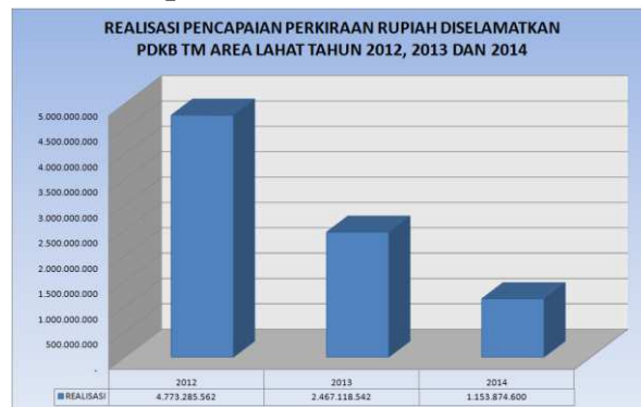
Gambar 5. Realisasi Pencapaian Perkiraan Rupiah terselamatkan oleh PDKB Tahun 2012 sd 2014