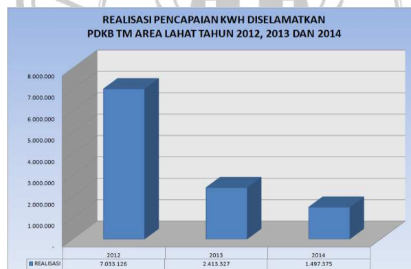
Gambar 4. Realisasi Pencapaian kWh terselamatkan oleh PDKB Tahun 2012 sd 2014

Perolehan kWh jual perusahaan yang diselamatkan oleh pelaksanaan PDKB tahun 2014 adalah 1.497.375 kWh dan Pendapatan perkiraan Rupiah yang diselamatkan bagi perusahaan adalah Rp. 1.153.874.600,-.